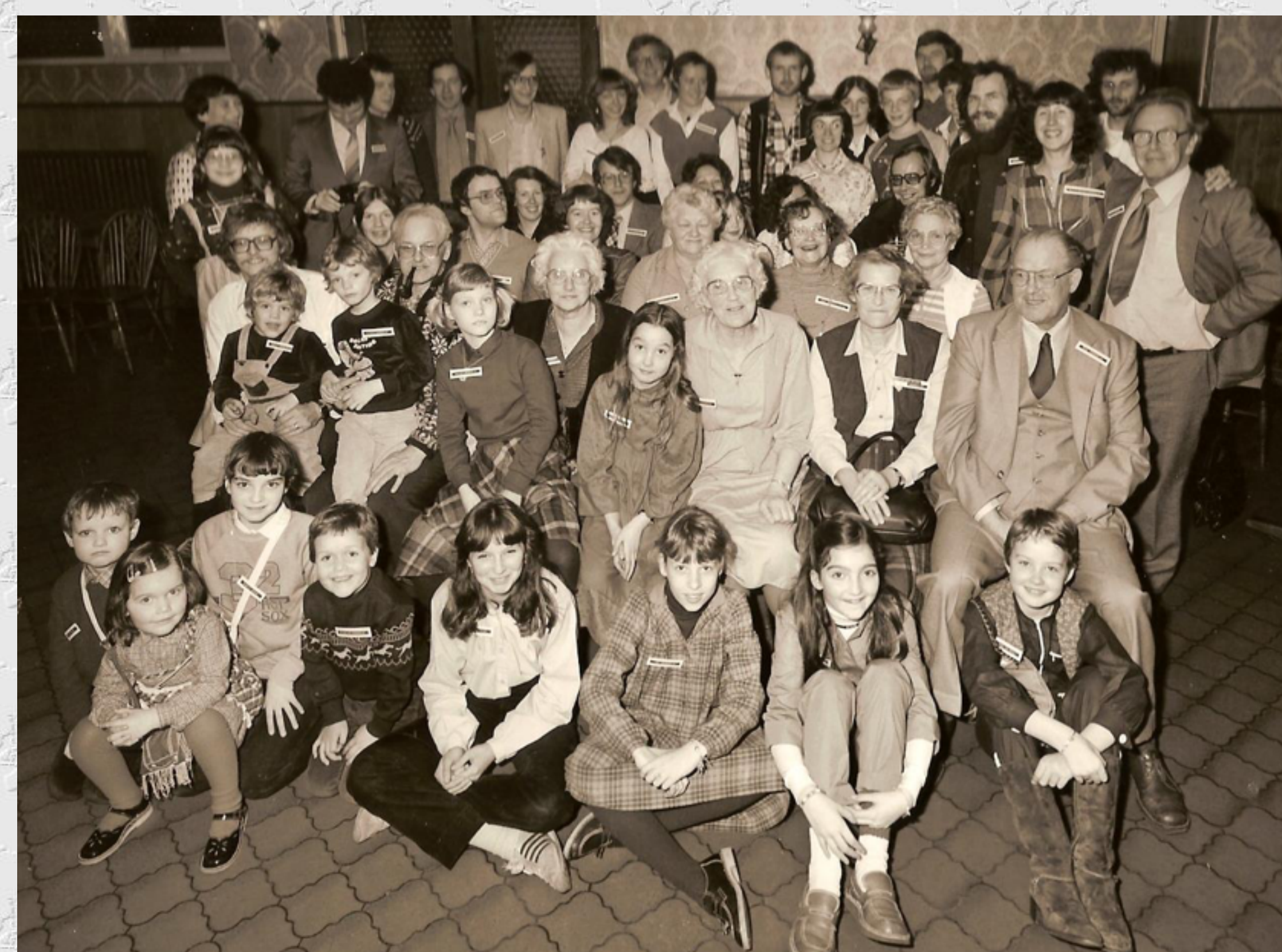
De Oegstgeester Courant schreef in 1982: