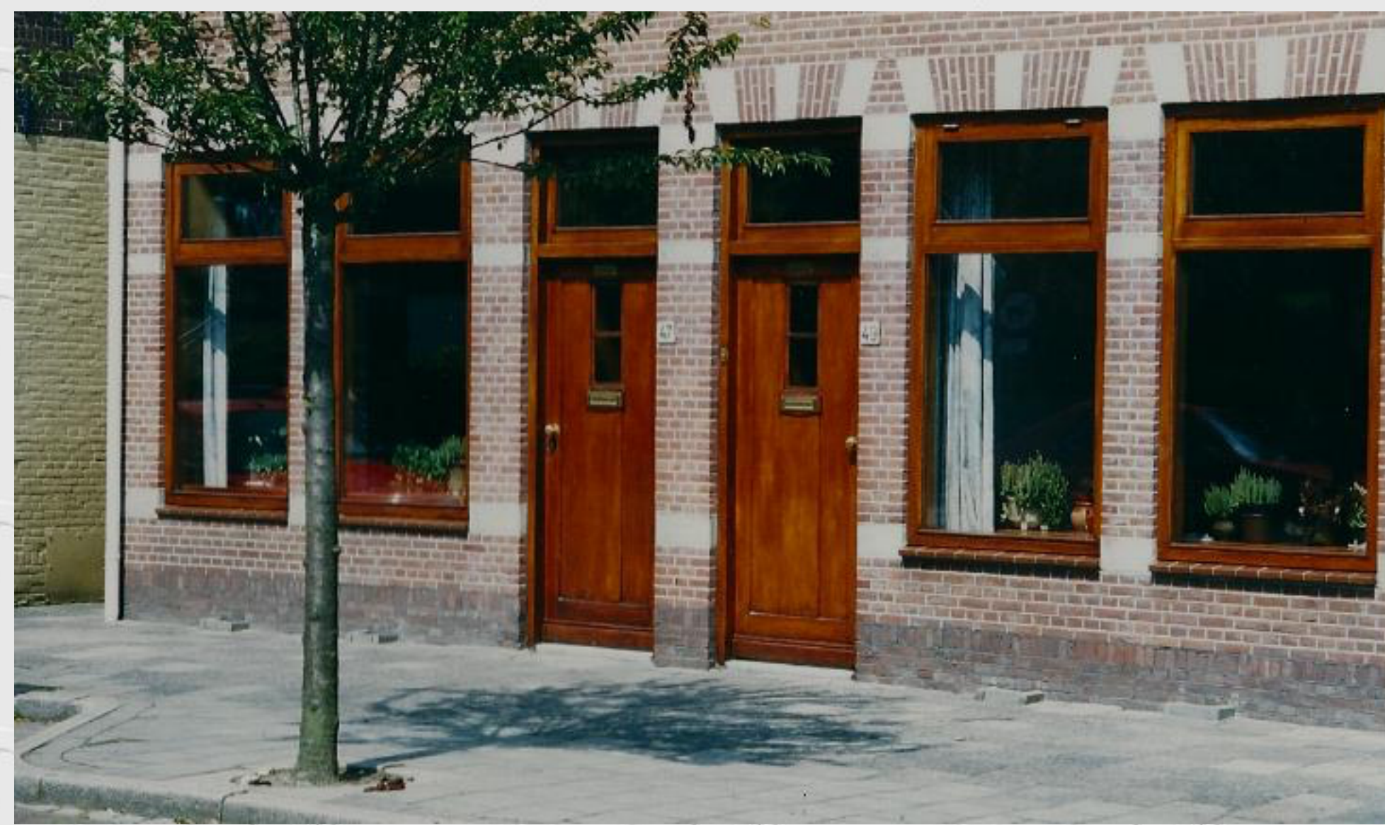
De woonhuizen Kempenaerstraat 47 en 49 zijn nu een woonhuis