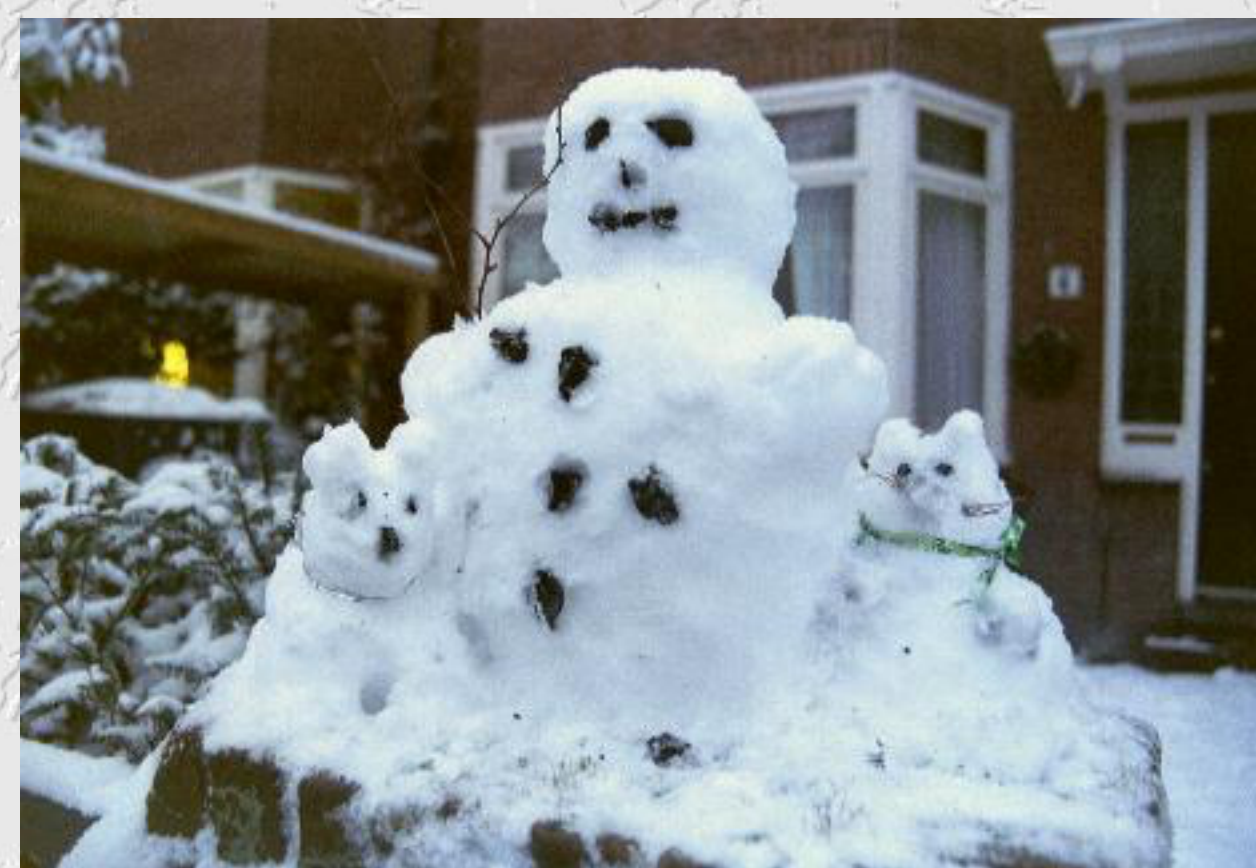
Sneeuwpret van de kinderen Laureijs