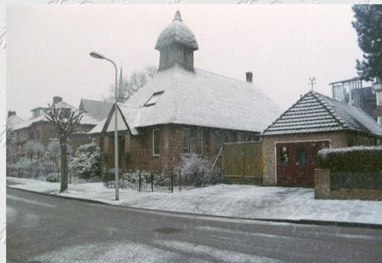
Kerkje in de Willem de Zwijgerlaan, vroeger in gebruik bij de Nederlandse Vereniging van Vrijzinnige Hervormden