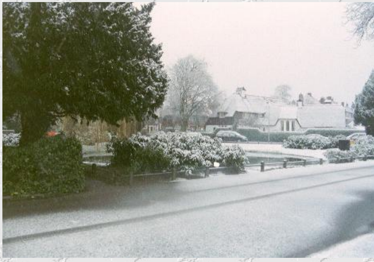
Plantsoen bij de Willem de Zwijgerlaan