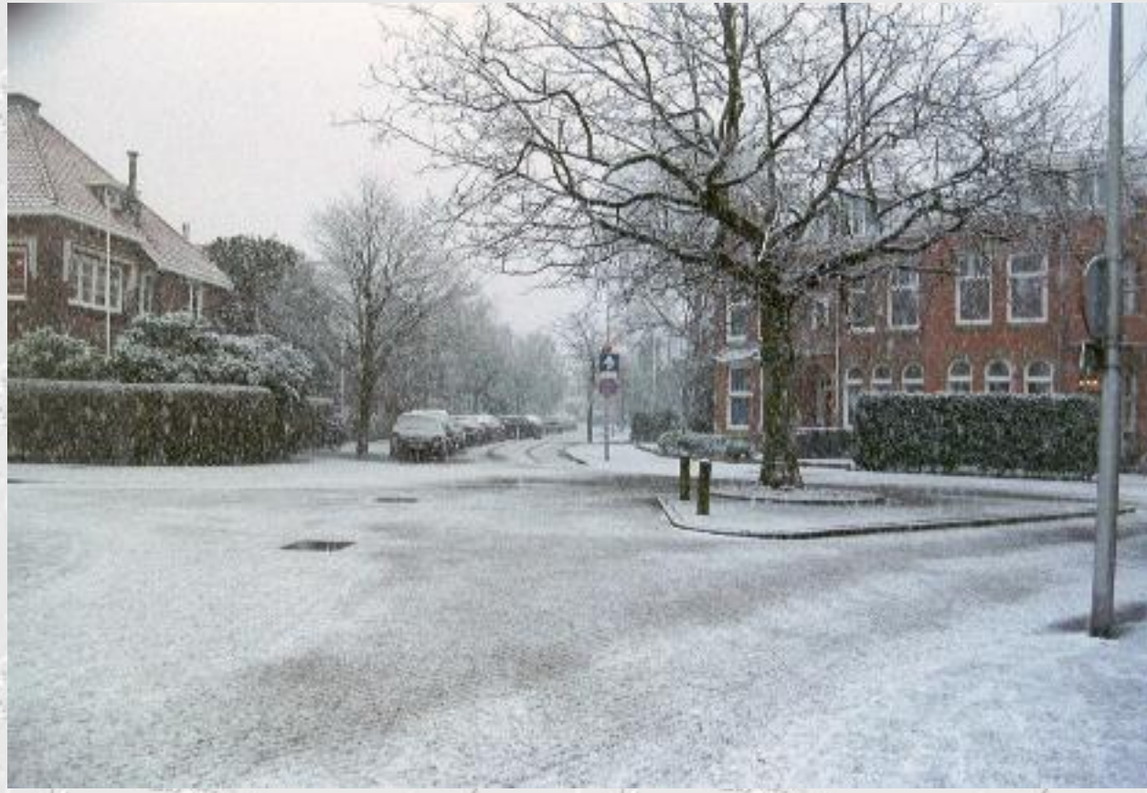
Hoek Julianalaan Koninginnelaan, kijkende in de richting van de Terweeweg