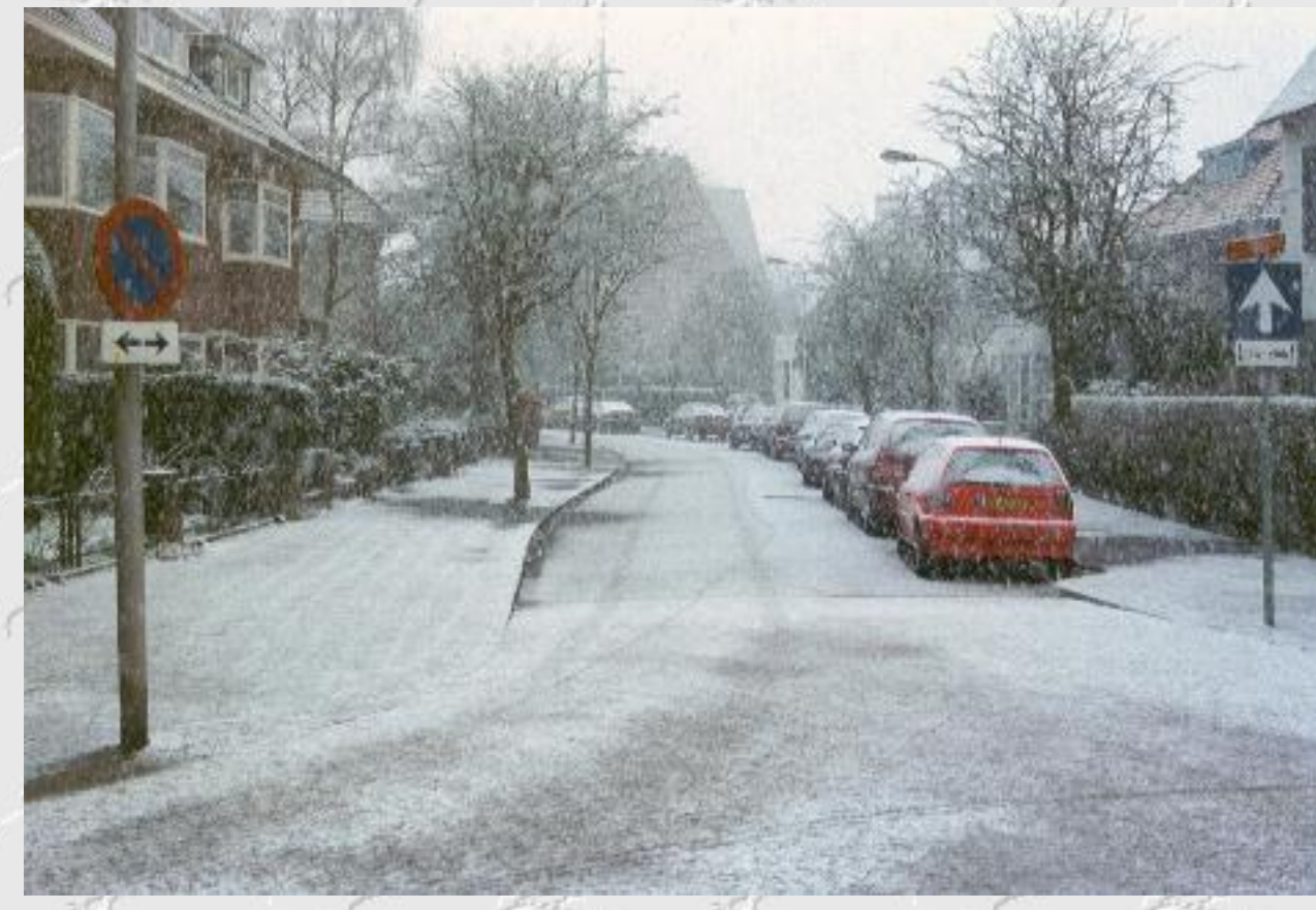
Hoek Julianalaan Koninginnelaan, kijkende in de richting van de SOW Regenboog Kerk