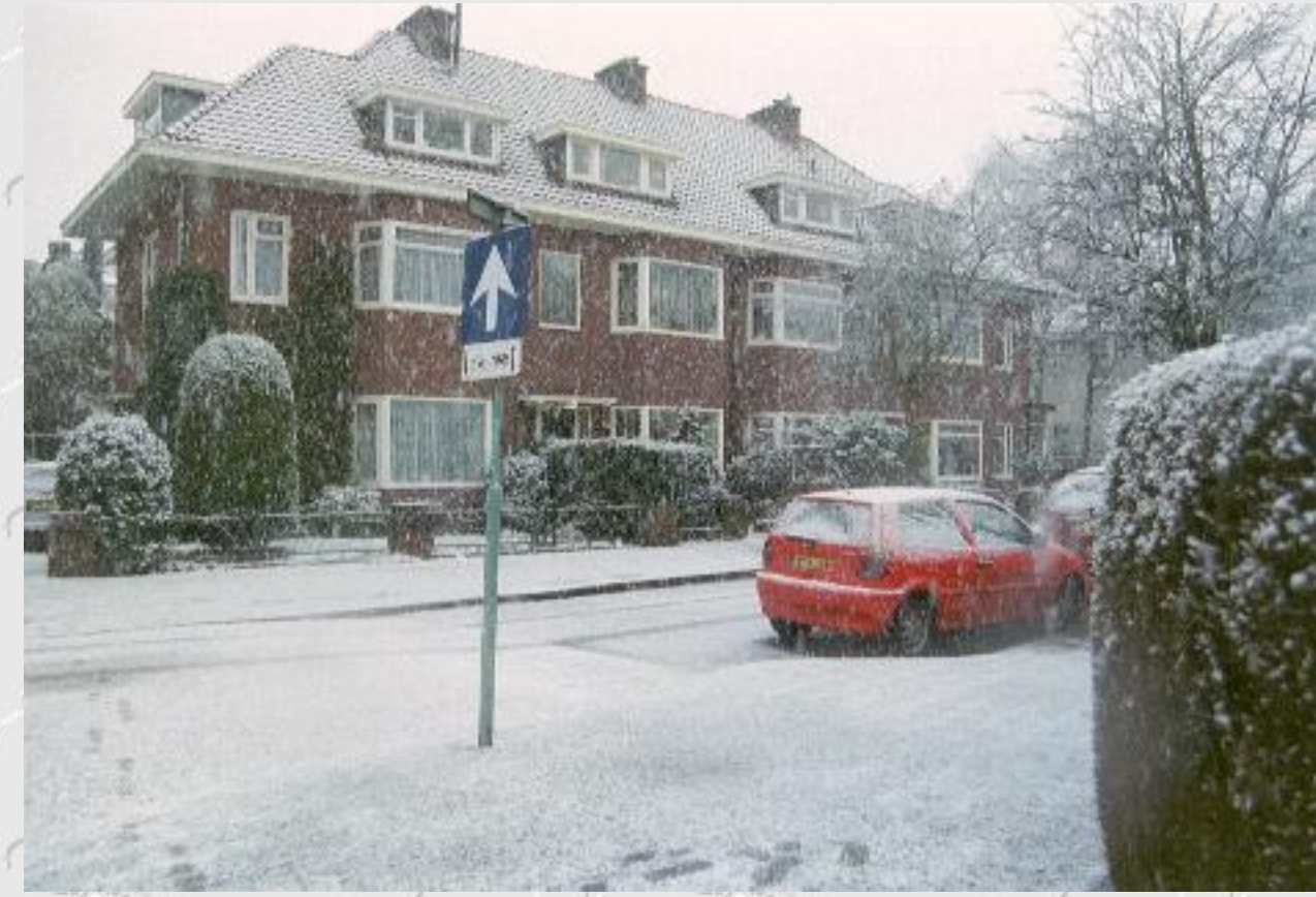
Julianastraat 4 t.e.m. 4c