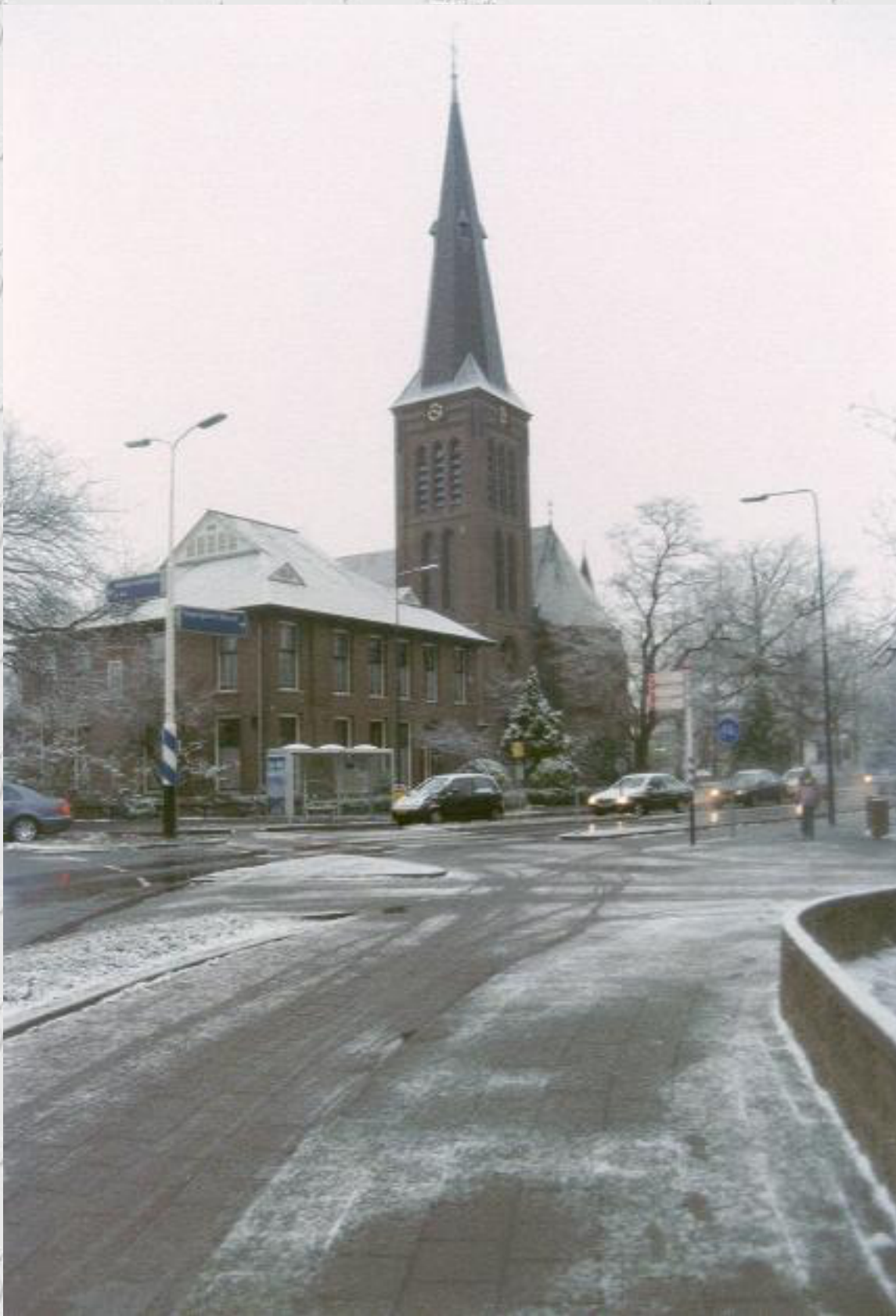
De R.K. Willibrordkerk, links vanaf de Geverstraat en rechts vanaf de Rhijengeesterstraatweg