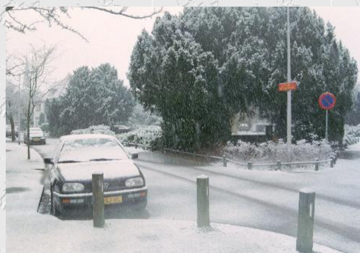
Willem de Zwijgerlaan bij de vijver