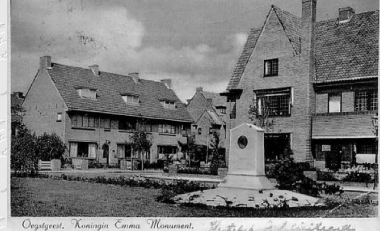
Oegstgeest, Koningin Emma Monument, Herengracht, Oegstgeest