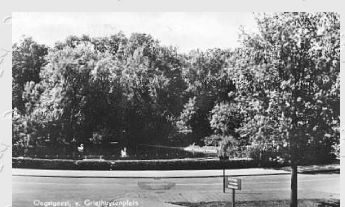
Oegstgeest, v. Griethuysenplein