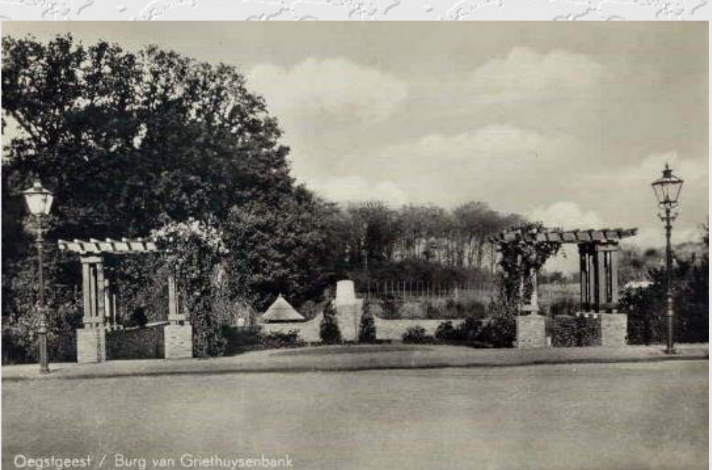
Oegstgeest / Burg van Griethuysenplein