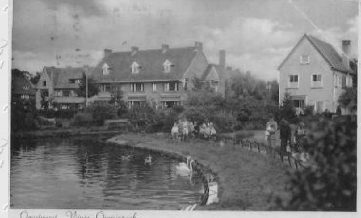
Oegstgeest, Nieuw Oranjeperk