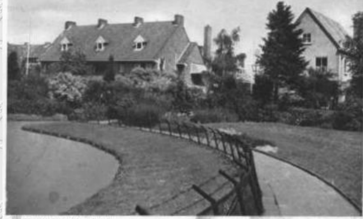
WEG VAN GRIETHUYSENPLEIN