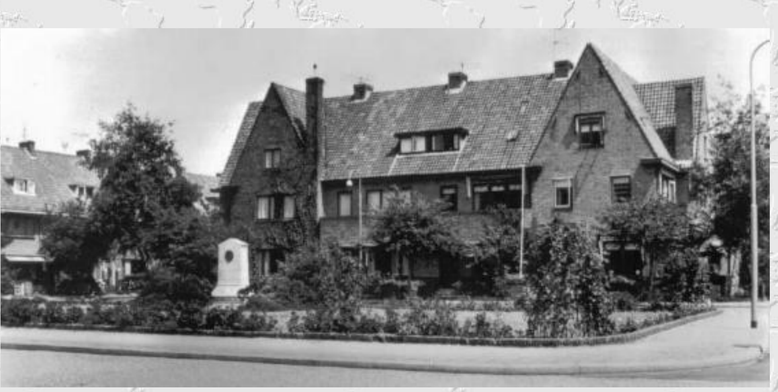
Louise de Colignylaan