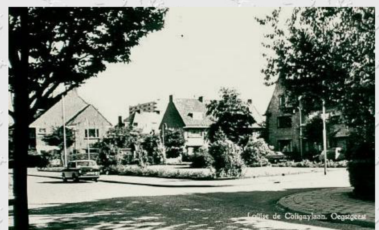
Louise de Colignylaan, Oegstgeest