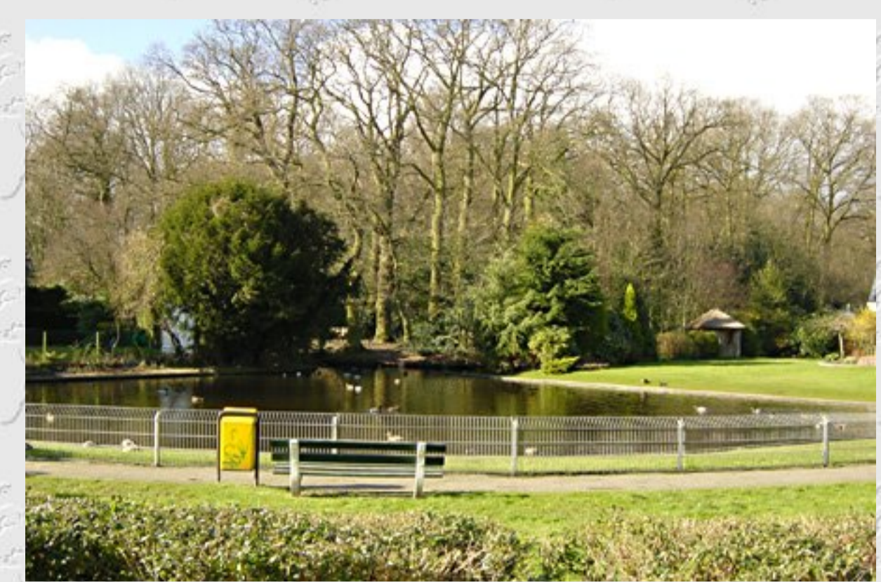
Burgemeester van Griethuysenplein 2004 © Wil van Elk, Oegstgeest