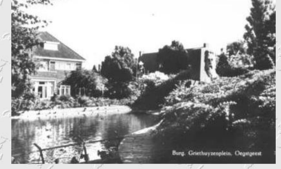
Burg. Griethuysenplein, Oegstgeest