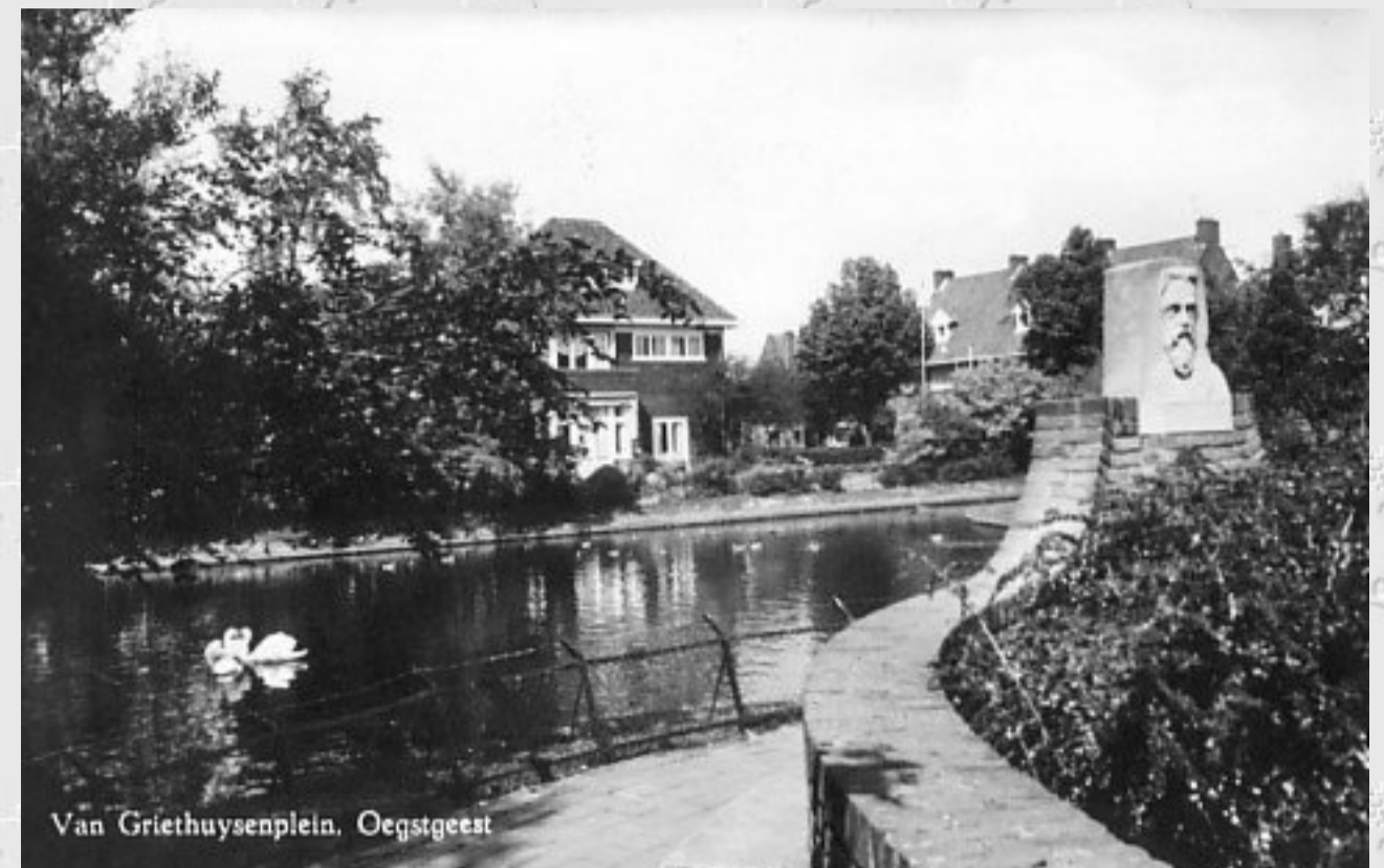
Van Griethuysenplein, Oegstgeest