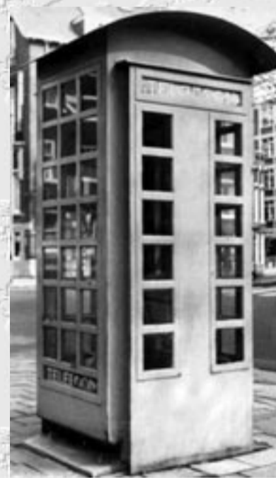
De eerste telefooncel in Nederland, Amsterdam 1931