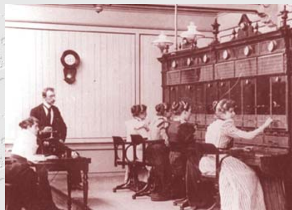
Telefooncentrale in 1898