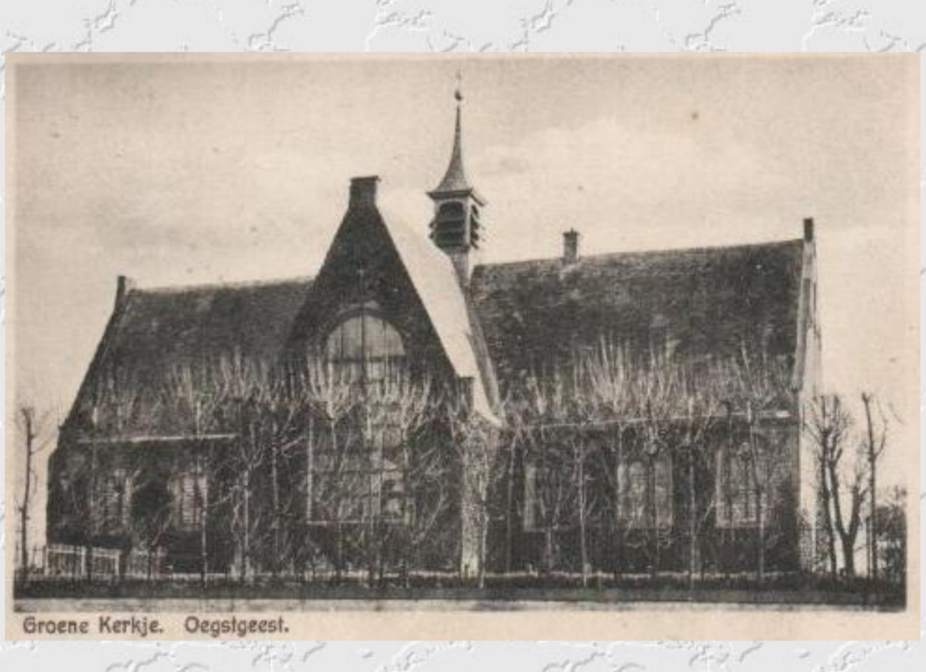
Groene Kerkje, Oegstgeest.