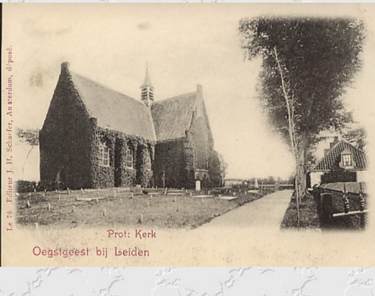
Prot. Kerk Oegstgeest bij beelden