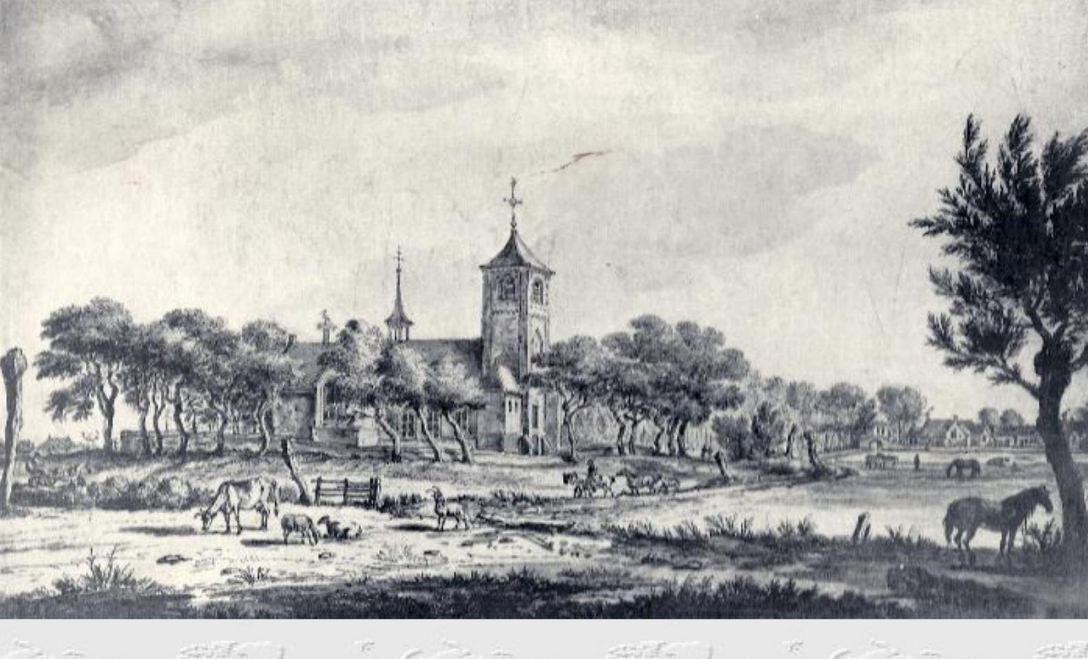
Het sinds eind 16e eeuw Hervormde Groene of Willibrordkerk. De toren die hier nog weergegeven is, is rond 1830 gesloopt wegens instortingsgevaar. De tekening is uit "Rhyndlands Fraaiste Gezichten", uitgave "Tot Amterdam, by LEONARDUS SCHENK, op den Vygendam 1732" uitgave "B.V. Foresta Groningen"