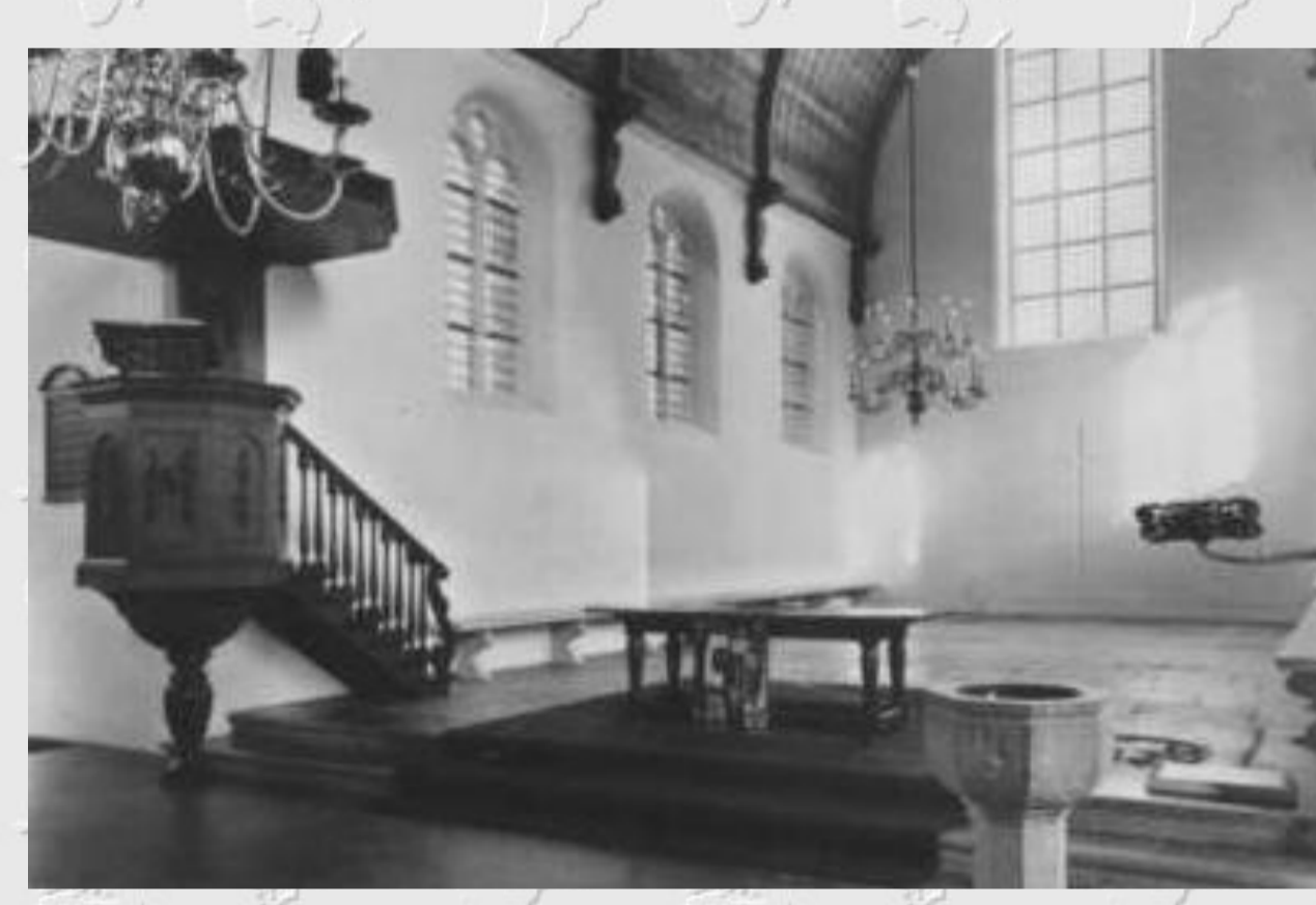
Interieur van Het Groene Kerkje