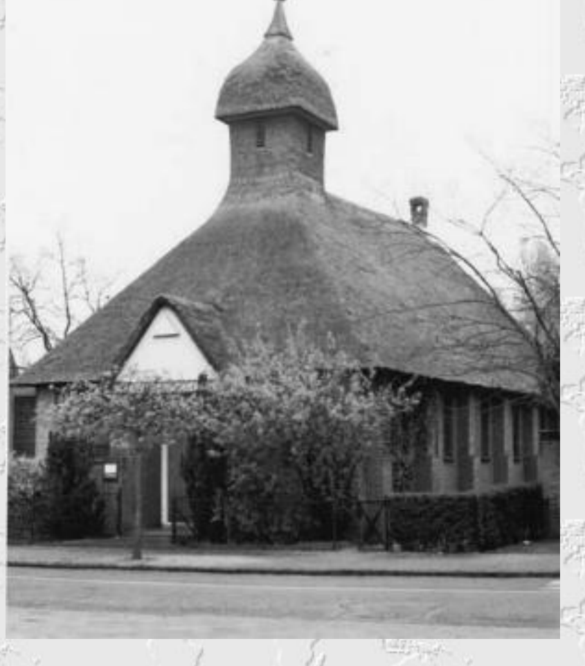
Oegstgeest, Hervormde Pauluskerk