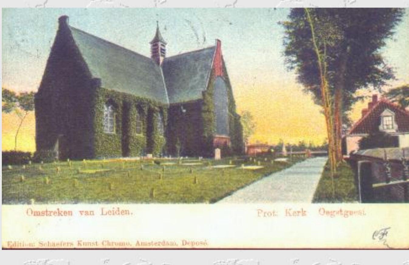
Uitsnede van Leiden. Prot. Kerk Oegstgeest.