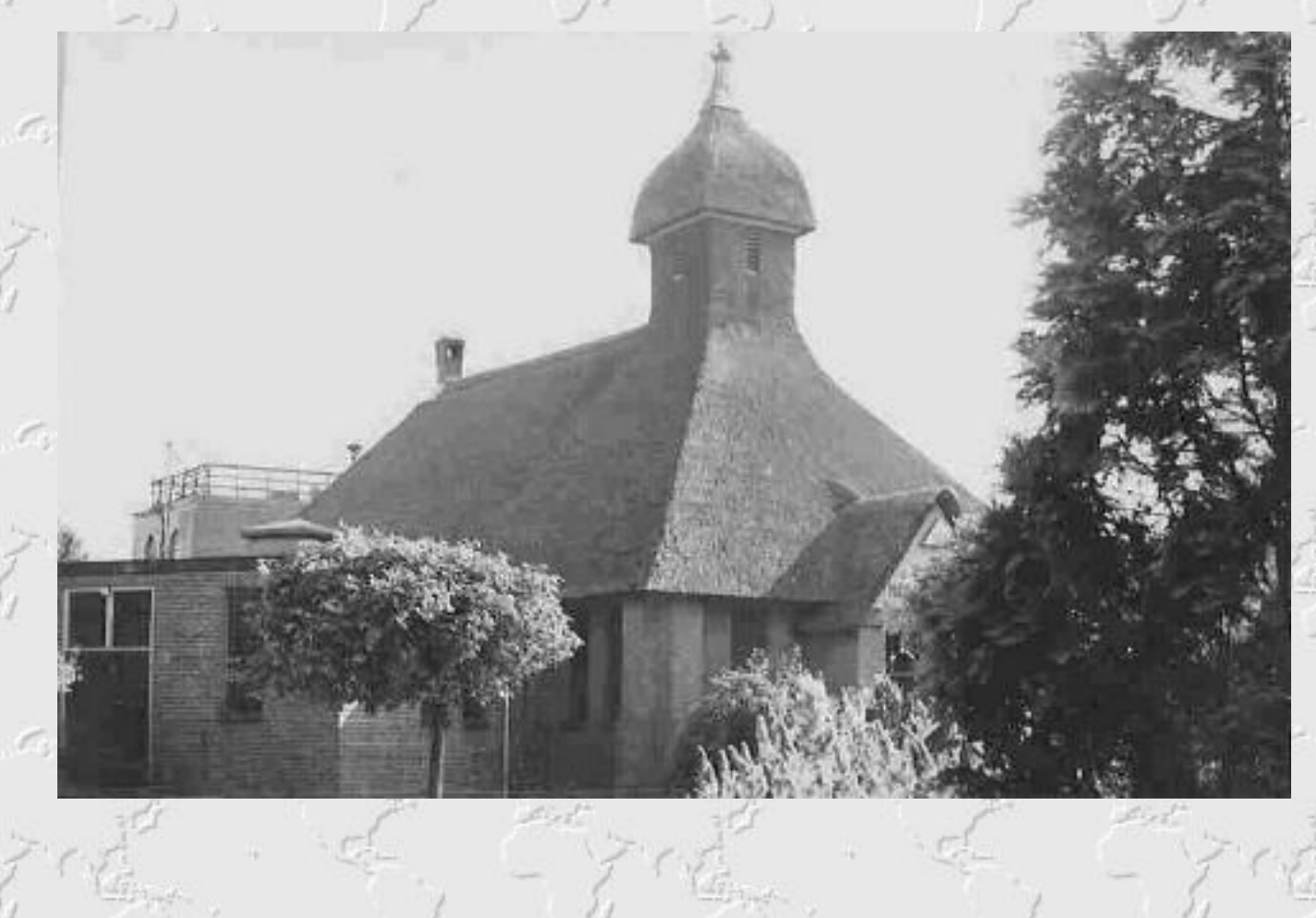
Oegstgeest, Hervormde Pauluskerk