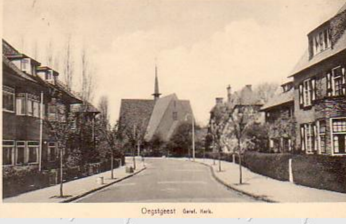
Oegstgeest, Hervormde Pauluskerk