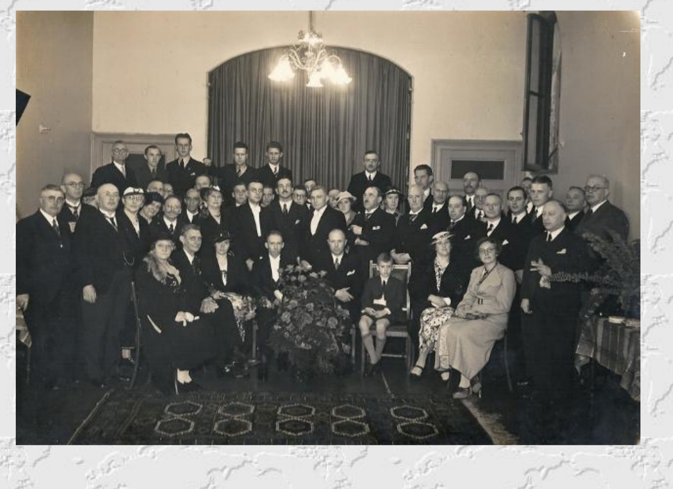
Kerkeraad en belijdende leden van de Pauluskerk, de foto is genomen in een van de zalen achter de kerk