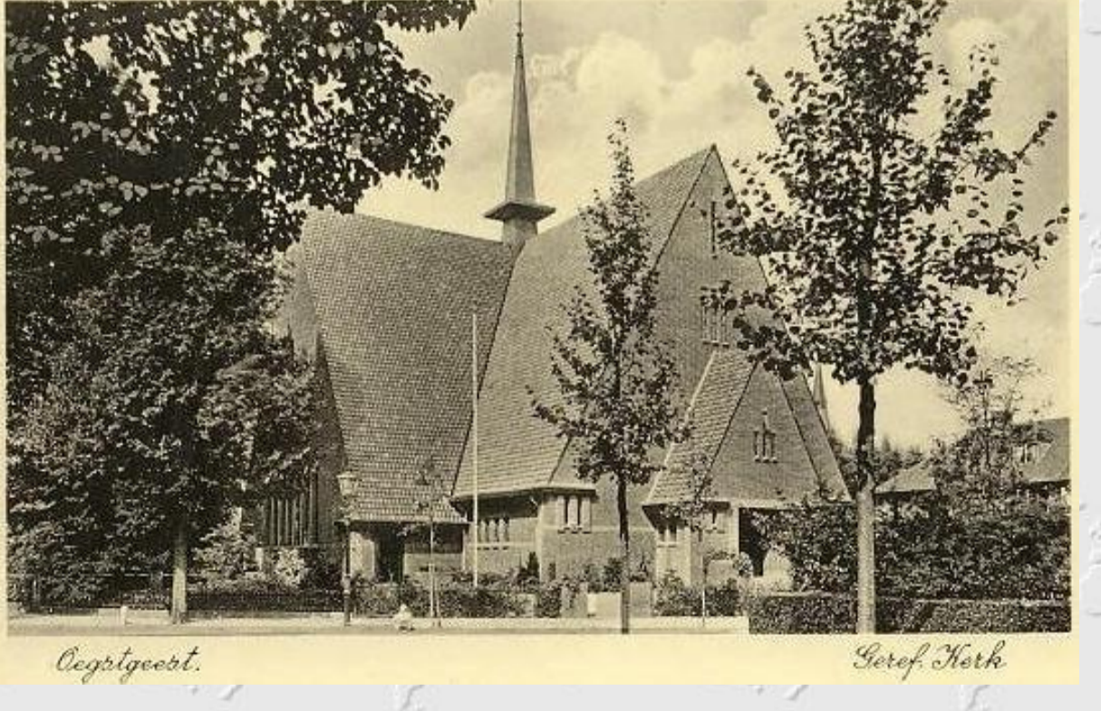
Oegstgeest, Hervormde Pauluskerk