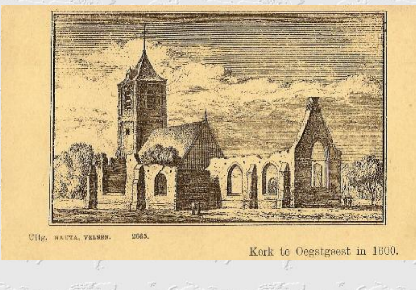
Een kaart uit 1920