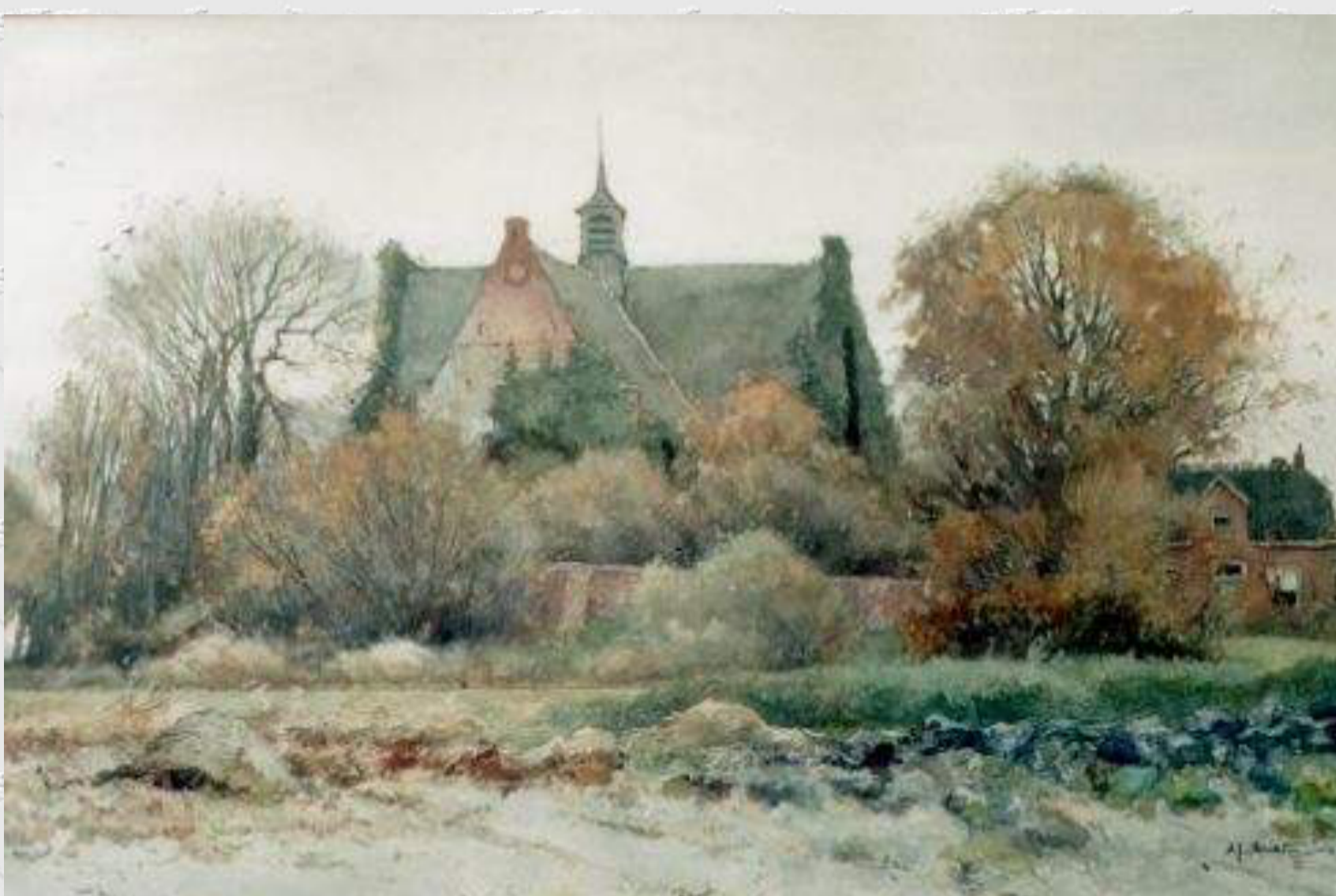
Het Groene Kerkje, een aquarel van Arend Jan van Driesten en het Groene Kerkje met de kosterwoning