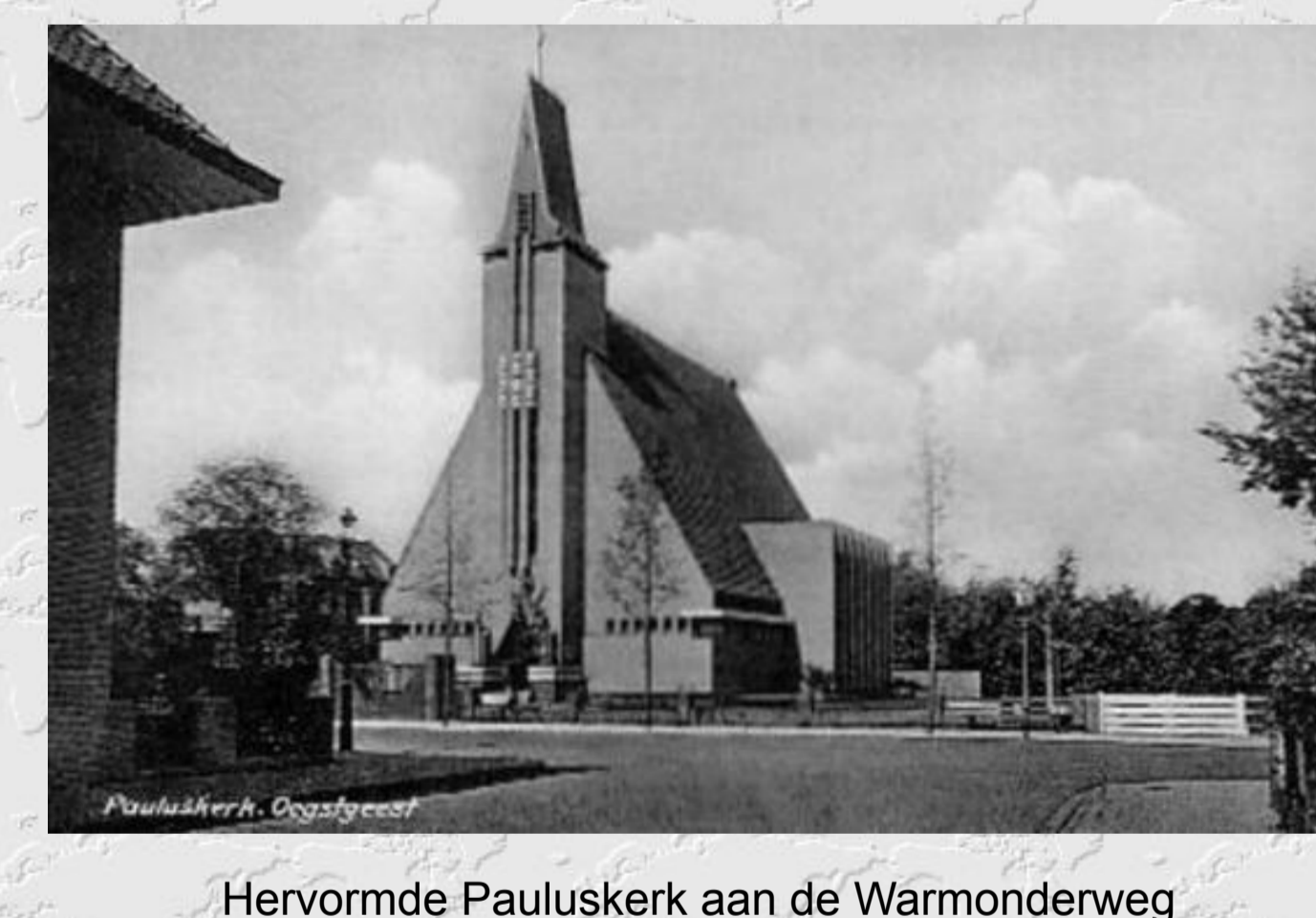
Hervormde Pauluskerk aan de Warmonderweg

Sinds 2007 is de Pauluskerk eigendom van de Stichting Pauluskerk Oegstgeest. In de kerk is thans het Cultureel Centrum de Paulus gevestigd. Op zondag vindt er een dienst plaats van de Volle Evangelie Gemeente Leiden s.o. en door de week worden er veel ballet- en muzieklessen gegeven door BplusC. Daarnaast worden de verschillende ruimten vaak verhuurd voor bewegingstherapie, yogalessen, muziek- en koortruvoeringen etc. Mogelijkheden over de verhuur zijn te vinden op www.cultureelcentrumdepaulus.nl