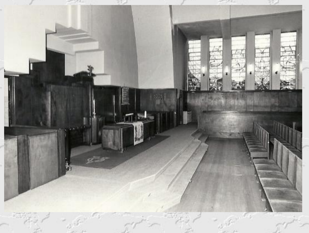
Interieur van de Pauluskerk

De Protestantse Gemeente Oegstgeest (PGO) houdt nu haar diensten in de gerenoveerde Regenboogkerk aan de Mauritslaan en het Groene Kerkje aan de Haarlemmerstraatweg in Oegstgeest