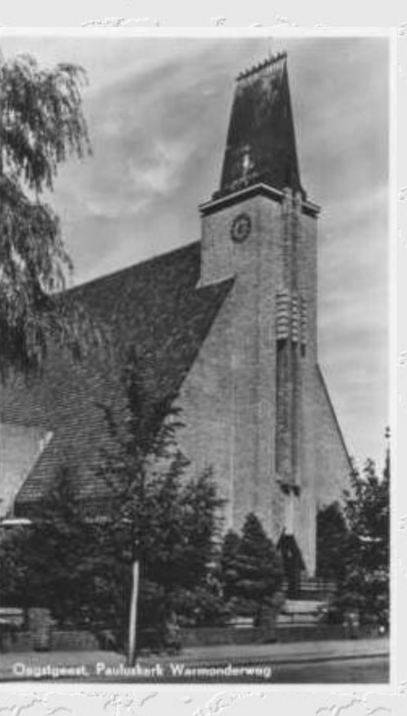
Oegstgeest, Pauluskerk Warmonderweg