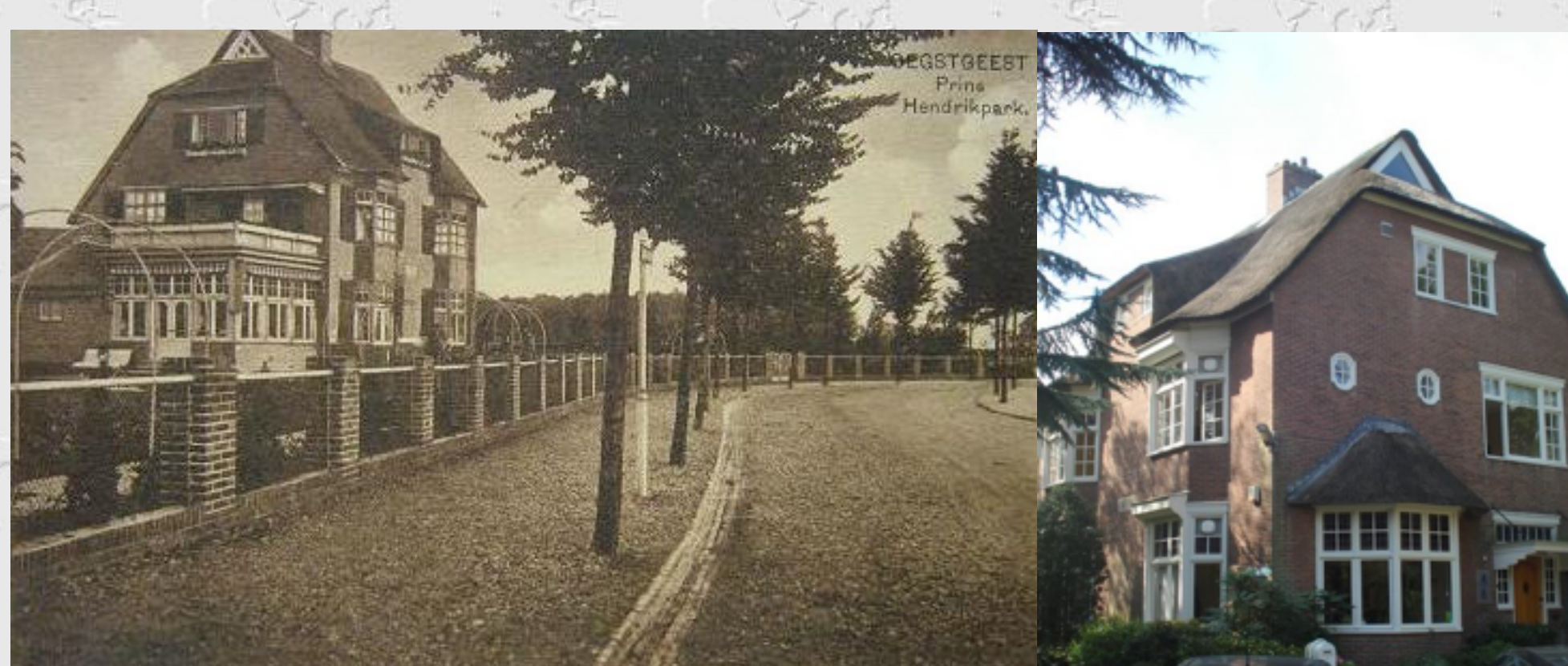
Een opname uit de 20-ger jaren en een opname uit september 2011

Een waardevol gebouw vanwege de hoofdvorm en detaillering, de materiaalbehandeling en de kleurstelling. De grote platte aanbouw past niet bij het gebouw. Hier was ook het bureau van Wilms en woonde hij met zijn gezin van 1920 tot 1921 en het is nu het kantoor van de er naast gelegen protestantse (voorheen Gereformeerde) kerk.