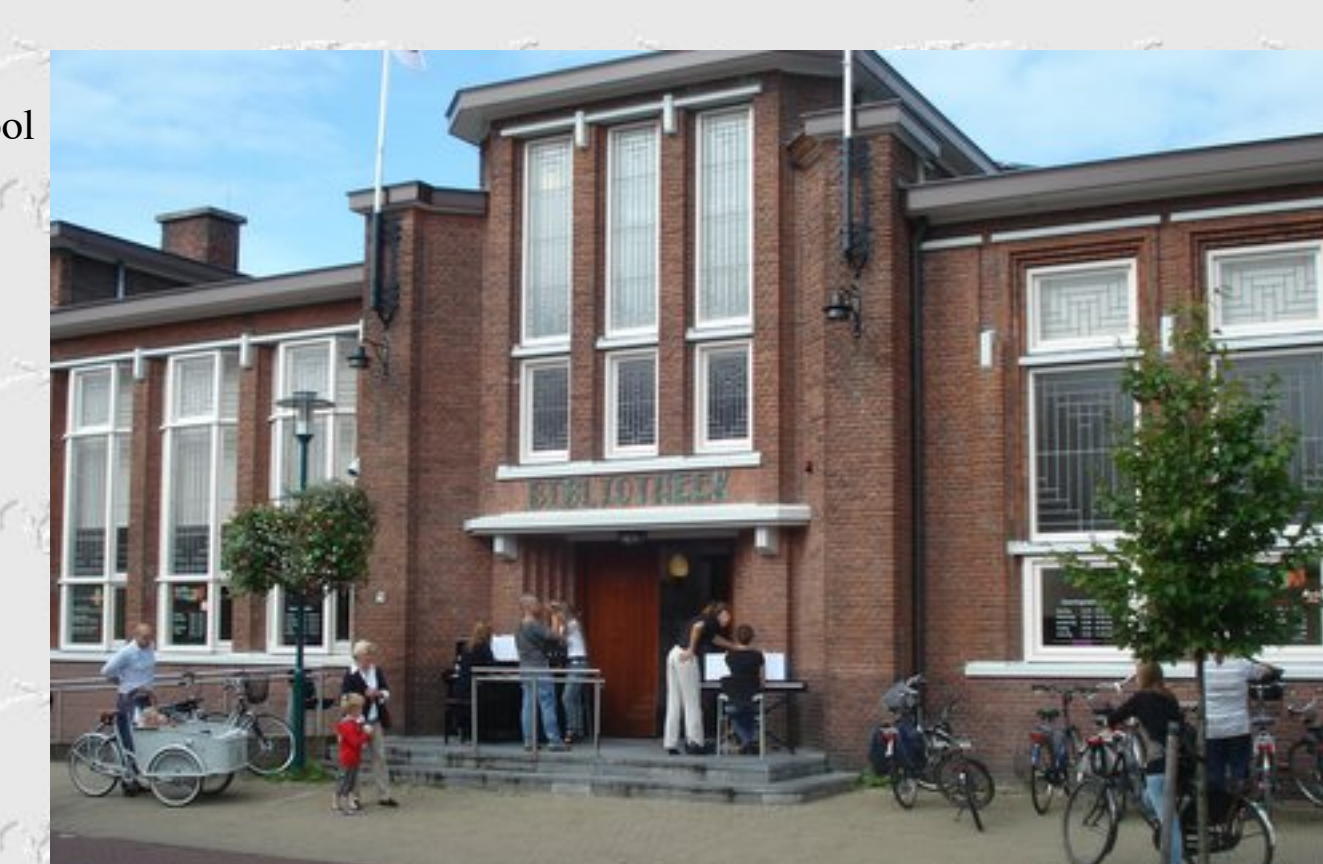
De bewaarde voorgevel van het concertgebouw