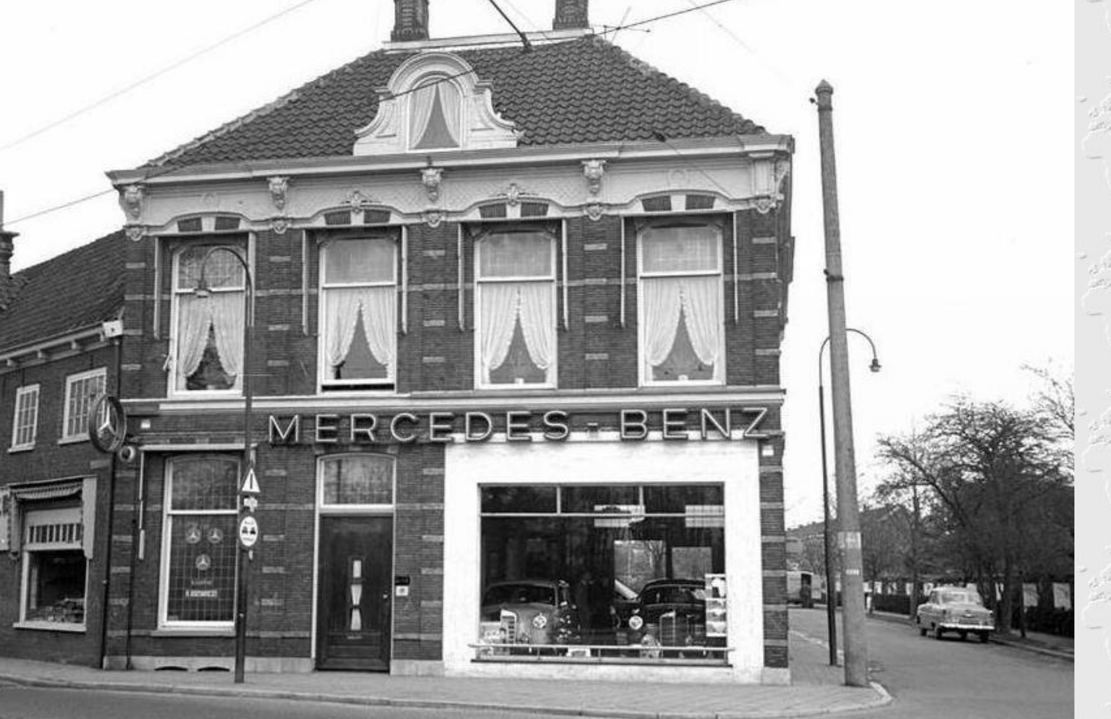
Links naast de Mercedes dealer was een speelgoedwinkel, rechom ga je de Terweeweg op.