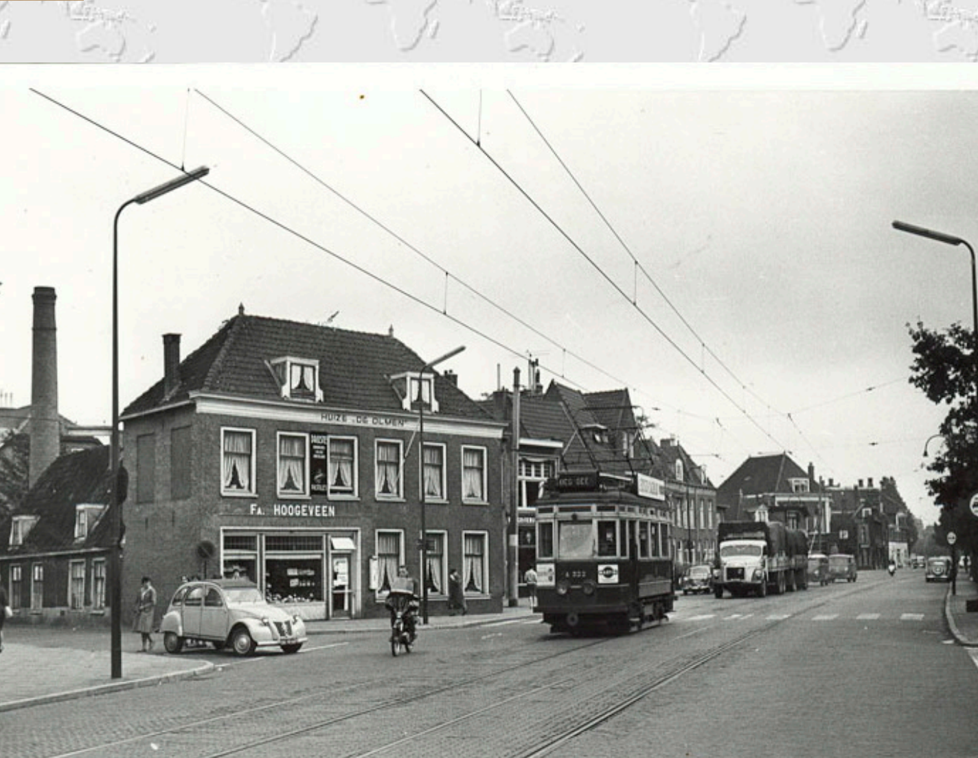
De zeven kaarten zijn ongeveer op dezelfde plaats genomen, t.h.v. Bakker Hoogeveen