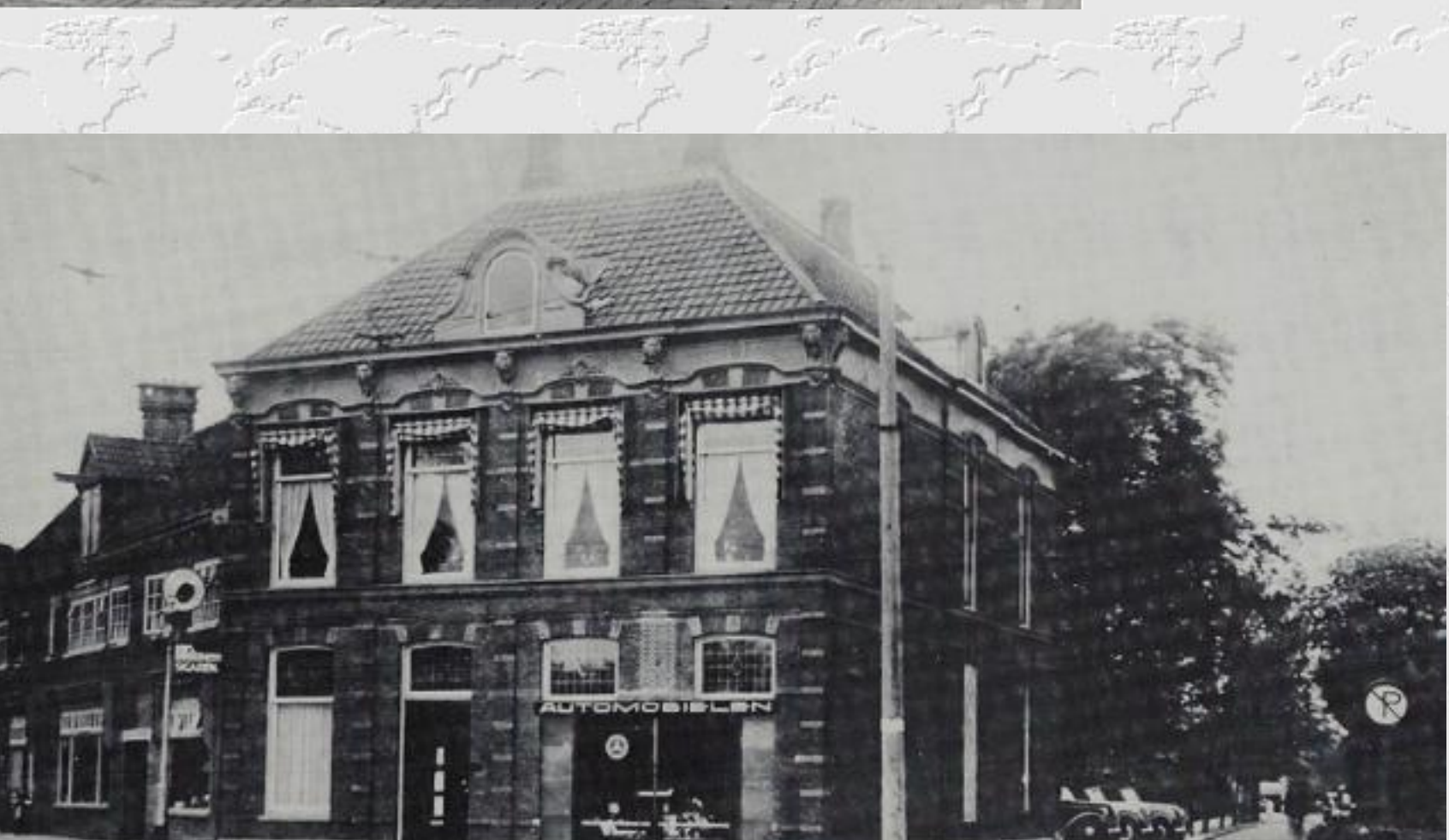
Het statige huis op de hoek van de Geversstraat en de Terweeweg ( vermoedelijk gebouwd rond 1850 ) bleef in 1939 huisvesting aan de kunstschilder Kamerlingh Onnes. Naïem was daar vele jaren het autobedrijf van Rooyackers gevestigd. Het pand werd in 1982 afgebroken om plaats te maken voor een benzinstation.