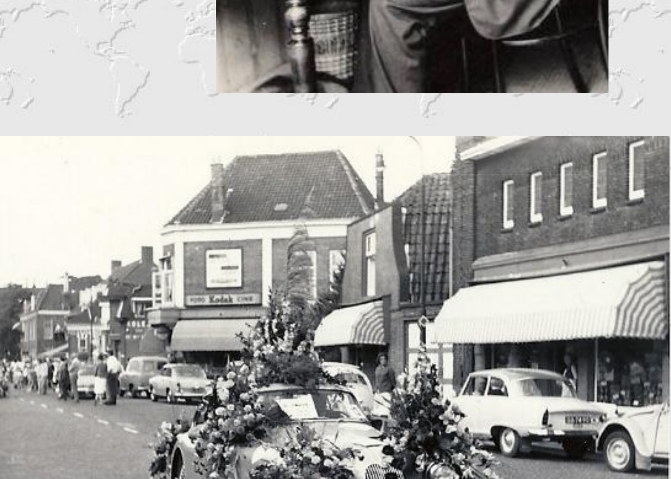
Bloemcorso trekt door de Geversstraat in de jaren zestig van de vorige eeuw