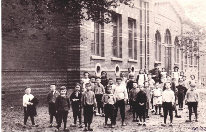
40-32 Jaartal helaas onbekend