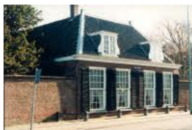
Klein Curium, 1994

Route: vanaf de Willibrordschool rechtdoor, langs het Bos van Wijckerslooth tot de Rijngeesterstraatweg 38. Daar vindt u het huis: Klein Curium en daarnaast het Klooster Duinzigt