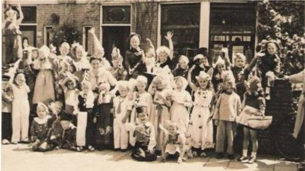
Kleuterschool aan de Warmonderweg 41

De school bestond uit 2 kamers en suite en een serre. In de gang bevond zich een 'grote mensen toilet' en in de keuken was de garderobe. Dit was niet ideaal.