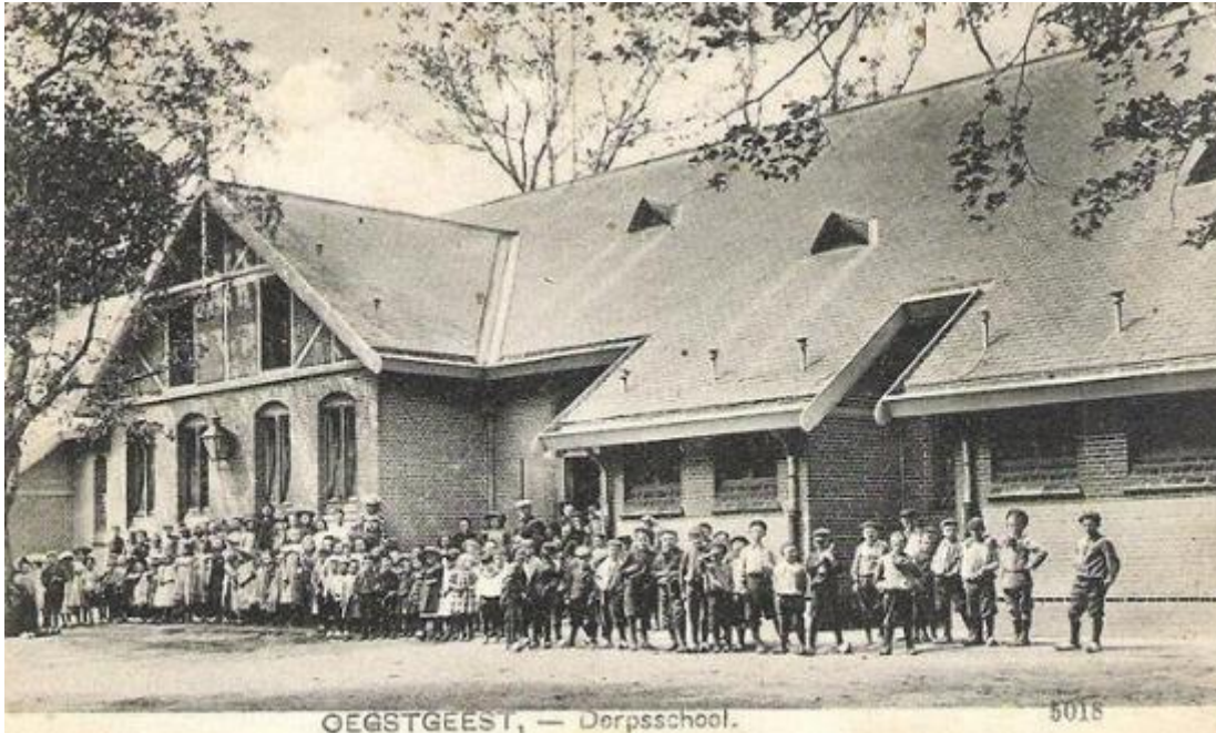
RK Willibrordschool 1910