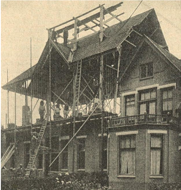
In 1912 werd de kap van het schoolgebouw opgetakeld om ruimte te maken voor twee lokalen.

In 1924 werd het gebouw uitgebreid met weer twee lokalen in een vleugel aan de achter(west-)zijde van het gebouw. Het jaar daarop bestond de school 25 jaar: