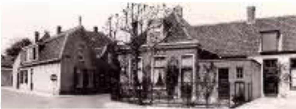
Hier is de noordzijde van de Deutzstraat te zien met de ingang van de Schoolstraat, 1950

Omdat het tracé van de tramlijn was verlegd kwam op 12 april 1934 de laatste tram de Schoolstraat uit gereden, pal naast het hoekhuis waarin ooit de onderwijzer van de school zijn woning had.