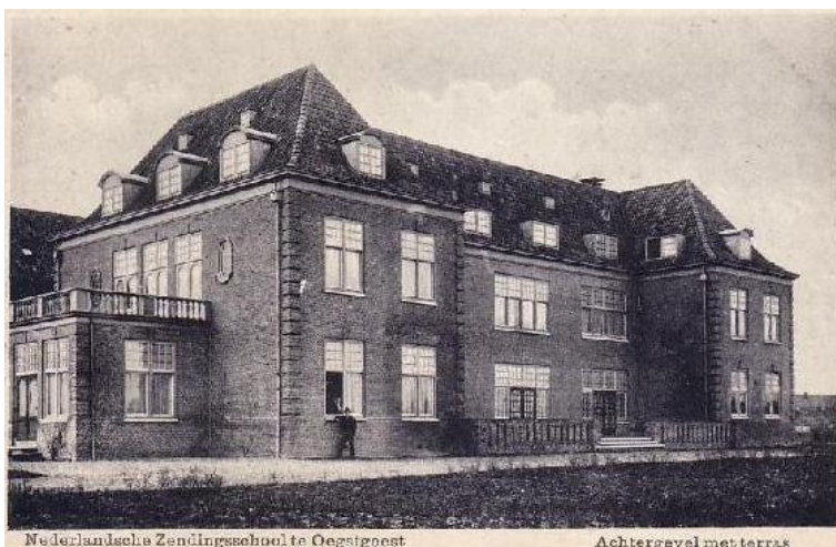
Nederlandsche Zendingsschool te Oegstgeest

In 1913 werd door het Nederlandsche Zendeling Genootschap en de Utrechtse Zendingsvereniging het besluit genomen om hun kantoren en de opleiding in Oegstgeest te vestigen. Hiervoor pleitte de aanwezigheid van de Universiteit Leiden met haar 'koloniaal onderwijs' te weten oosterse talen, godsdienstonderwijs, land- en volkenkunde gericht op Nederlands-Indië en het medisch onderwijs. Een prachtig stuk bouwgrond, een kwartier lopen van het station en vijfhectaren groot werd te koop aangeboden door het bestuur van de Oude Hofpolder. De bouw van de school met bijgebouwen werd gegund aan de firma Wajer en Schuurman uit Amsterdam; het ontwerp van het gebouw in de nieuw historiserende stijl was van de hand van architect J. Stuivinga te Zeist. Op 12 september 1917 werd het Zendingshuis officieel geopend.