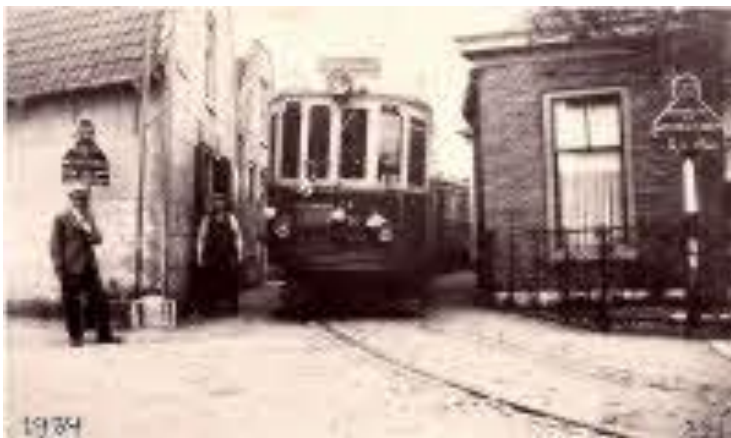
De tram naast de voormalige onderwijzerswoning, 1934

Dat maakt dat er van deze school geen foto's zijn uit de tijd dat er werd les gegeven. Het gebouw van de voormalige school is wel vastgelegd op diverse foto's.