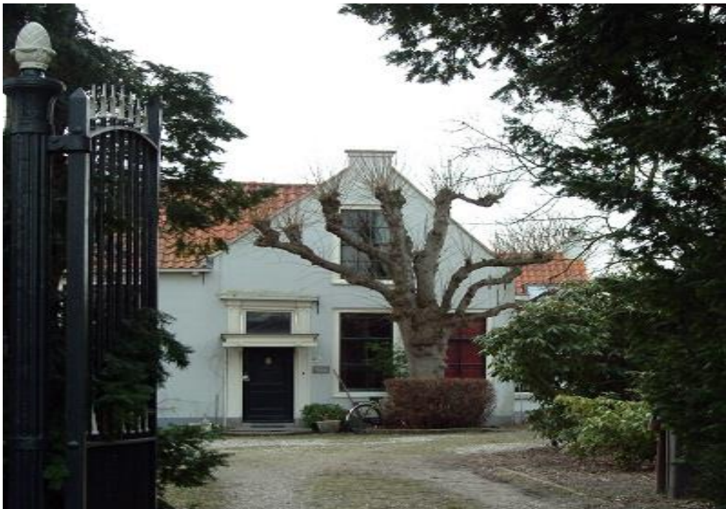
Oude pastorie, Groenhoevelaan 41

Route: vanaf de Rhijngeesterstraatweg rechtdoor. Bij de bocht van de Kennedylaan linksaf de Dorpsstraat in. De eerste straat links is de Groenhoevelaan.