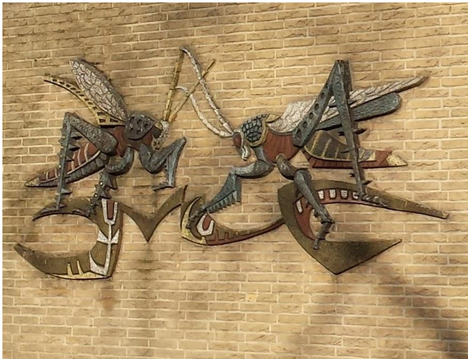
Deze sprinkhanen hangen aan de zuidzijde van de Rehobothkerk aan de Lijtweg 1

Route: Ga terug naar de Dorpsstraat naar de Rhijngeesterstraatweg. Als de Dorpsstraat overgaat in de Rhijngeesterstraatweg, linksaf de Wijttenbachweg op. Oversteken op de Lange Voort en de Wijttenbachweg volgen tot de Lijtweg. Hier rechtsaf en dan hebt u aan uw rechterhand de Rehobothkerk de vroegere kleuterschool De Sprinkhaan.