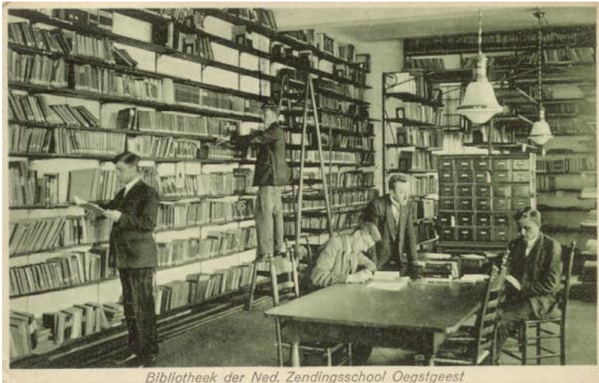
Bibliotheek der Ned. Zendingsschool Oegstgeest

bevolkten. De eerste twee jaar werd besteed aan aanvulling van de algemene ontwikkeling tot het toenmalige mulo niveau. In het derde en vierde jaar werd theologisch onderwijs gegeven. In de laatste twee jaren, als men wist waar men terecht zou komen, volgden onderwijs in de streektaal, land- en volkenkunde terwijl daarnaast medische, landbouwkundige en technische cursussen werden gevolgd.