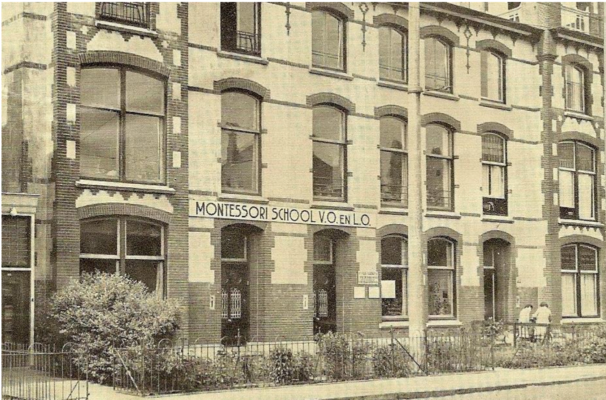
De panden aan de Geversstraat 46 en 48