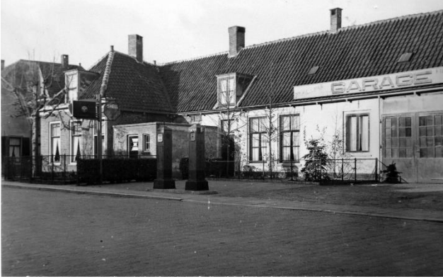
Garage Van den Ameele