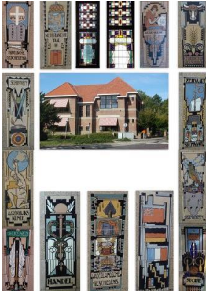
De tegeltableaus in het trappenhuis

Even voorbij het gebouw bevindt zich een parkeerplaats, waar u de auto kunt neerzetten als u deze dwaaltocht te voet wilt doen.