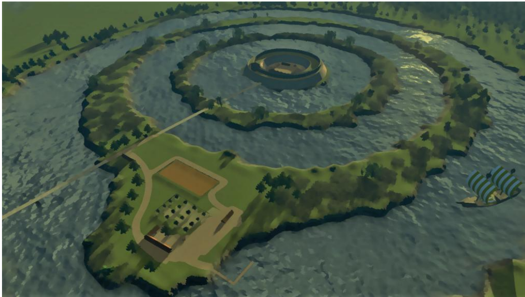
'artist impression' van hoe de Oudenhof er mogelijk uitzag

In de 9 e eeuw werd Europa geteisterd door invallen van de Vikingen. In 856 was het de beurt aan Noordwijk en werd priester Jeroen vermoord. In Oegstgeest ging het Groene Kerkje in vlammen op.