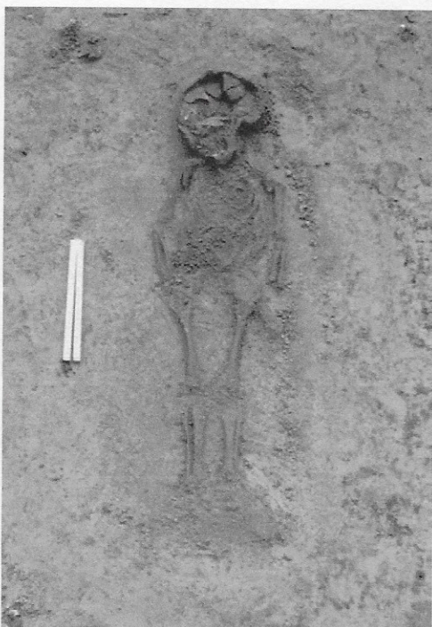
Het skelet van een ongeveer vijfjarig kind, in 2011 opgegraven in Overdorp.

zijn er honderden kuilen gevonden, die voor allerlei doeleinden werden gebruikt: waterput, opslagplaats, afvalput. De wanden van de waterputten waren gemaakt van hergebruikte delen van schepen of van wijntonnen. Op een duig van een daarvan zijn merktekens aangetroffen die wellicht het enige bekende Merovingische schrift in deze streek vormen. Waterputten die onbruikbaar werden, veranderden in afvalputten. Daarin is veel huishoudelijk afval gevonden, zoals het onvermijdelijke gebroken aardewerk, voor een klein deel handgemaakt in de nederzetting zelf, voor het grootste deel gedraaid. Dit moet zijn geïmporteerd uit de stroomopwaarts gelegen productiecentra in het Rijnland. Ook Angelsaksisch aardewerk is aangetroffen. Een houten drinknap is eveneens gevonden, evenals een van handvaten voorziene en fraai bewerkte trog, weefgewichten, een naald, een kam, diverse munten, een gebroken handboog, enzovoort. Bij de opgravingcampagne van 2011 kwam onder meer nog een grote structuur aan het licht, mogelijk een opslagloods, alsmede houten looppaden, het volledig intacte skelet van een begraven kind en belangwekkende skeletten van eveneens begraven paarden.