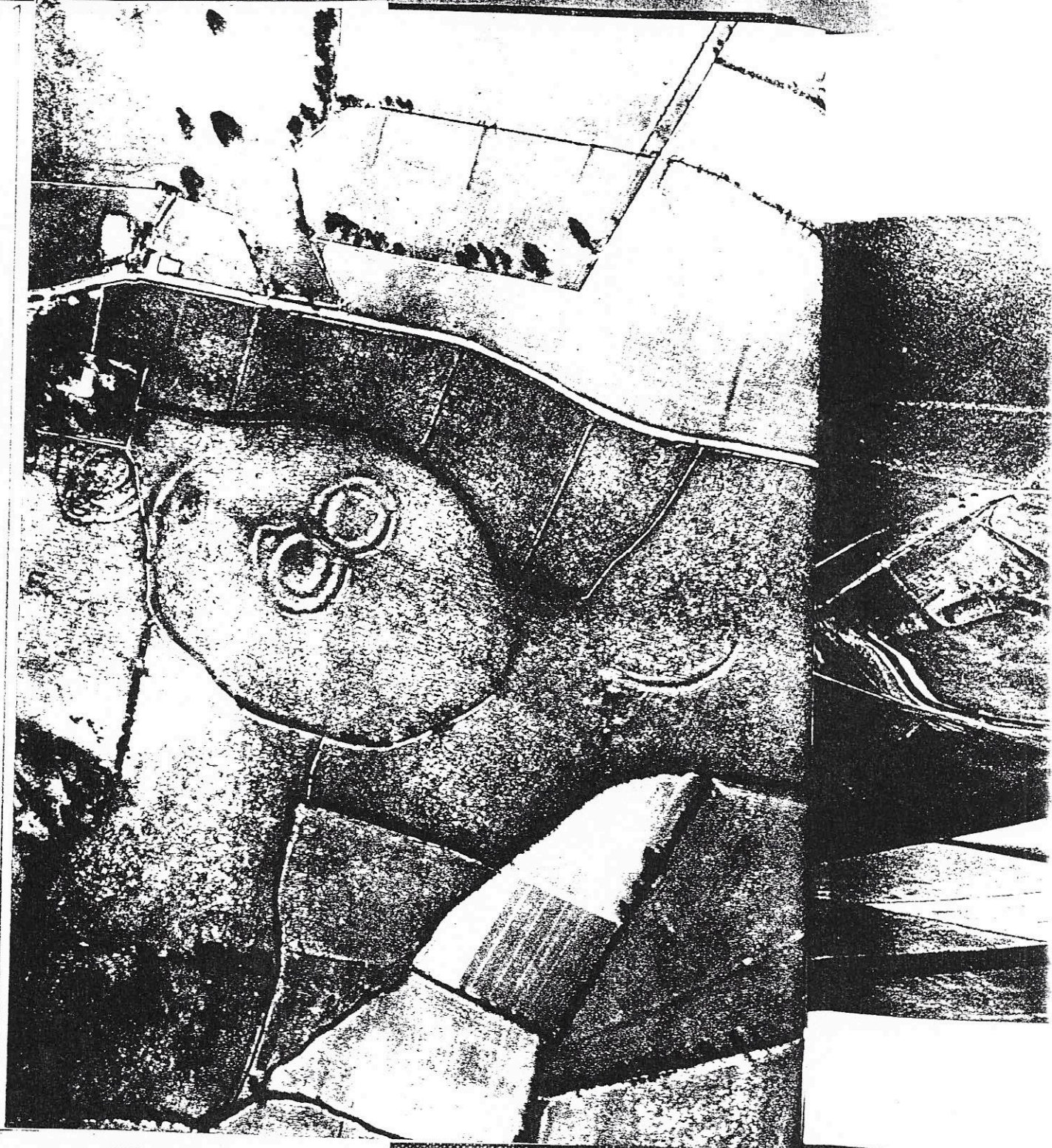
Tara, aarden omwallingen, afb. uit T.G.E. Pwell, The Celts, 1958

an re- nd he cal ng he ty us ed in ce pt l ll n n