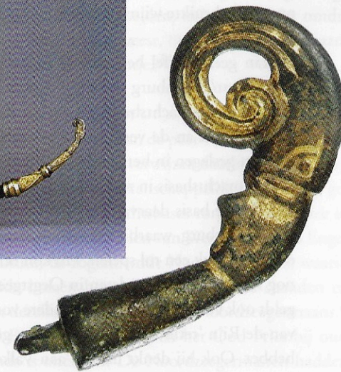
Verguld bronzen drinkhoornbeslag, afkomstig uit Katwijk. Ter illustratie is tevens een in Taplow, Engeland, gevonden drinkhoorn uit dezelfde tijd afgebeeld, met overeenkomstig beslag.

uit een koninklijke schatkamer. 61 Is dit zo'n geschenk, dat uiteindelijk, bij het verlaten van het dorp, aan de goden is geofferd als dank voor de successen in het verleden of in de hoop op een goede toekomst?