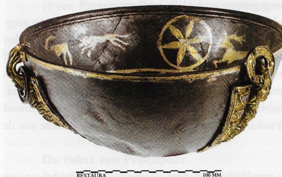
De Schaal van Oegstgeest.