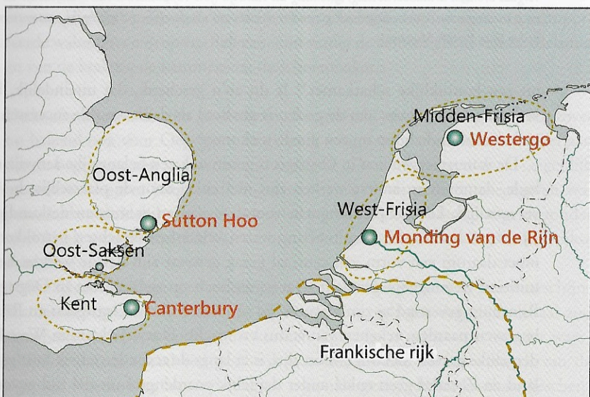
Rond 600 zijn er koninkrijken in Westergo, aan de monding van de Rijn, in Kent en rond Sutton Hoo (naar Nicolay 356).

Er kan geen twijfel bestaan dat in de zevende eeuw in Valkenburg/Katwijk en Oegstgeest/ Rijnsburg belangrijke personen hebben gewoond en dat daar toen een regionale machtsbasis is geweest. Dit wordt onderstreept door de gevonden wapengraven en de vermoedelijke aanwezigheid van een muntmeester: munten worden geslagen in het centrum van de macht. Dijkstra preludeert al op een dergelijke machtsbasis in zijn onderzoek naar 'centrale plaatsen' langs de Rijnmond. 63 Hij ziet de basis daarvan overigens eerder in Valkenburg/Katwijk dan in Oegstgeest/Rijnsburg, waarbij het drinkhoornbeslag, de muntmeester en het wapengraf onder de kerk een rol spelen. Hij kon echter bij het schrijven van zijn proefschrift nog niet de laatste vondsten in Oegstgeest in zijn beschouwingen betrekken. Dit geldt ook voor Nicolay. Uit de oudere vondsten leidt deze af dat langs de monding van de Rijn 'retinues' moeten hebben gewoond, vertrouwelingen van de machthebber. Ook hij denkt daarbij aan Valkenburg, en wel omdat het voor de hand ligt dat een regionale heerser zijn intrek neemt in het oude Romeinse castellum. 64