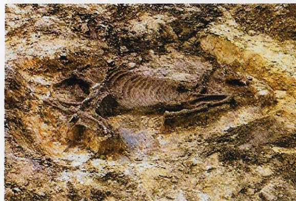
Een van de in Oegstgeest gevonden virtueel begraven paarden.

De in Oegstgeest gevonden paarden- en hondenbegravingen laten zien dat er belangrijke personen hebben gewoond. Wie zich kan veroorloven te worden begraven met twee forse, nog jeugdige paarden, die ook bij leven al een teken van aanzien waren, is zonder twijfel een belangrijk en aanzienlijk man geweest. Het doden van een goed rijdier, getuigd en wel, moet een nog groter vertoon van macht en status zijn geweest dan het berijden van zo'n dier, zegt Buhrs terecht. 57 In dezelfde sfeer is de vrouw met haar begraven honden te plaatsen. Stoffelijke resten van andere honden zijn in het dorp tussen het afval gevonden, die waren dus blijkbaar van de mindere goden in het dorp. De begraven honden mochten netjes bij hun meesteres worden begraven. Wellicht gebeurde dat zelfs al voor de dood van de vrouw: was voor haar al een plaats gereserveerd aan de top van de parabool? Natuurlijk is dit niet meer dan