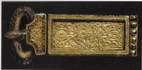
In Rijnsburg is deze gouden gesp gevonden.

zijn een stuk of twintig verloren geraakte of aan de goden geofferde goudstukken teruggevonden. Dat is de grootste concentratie van gevonden zesde- en zevende-eeuwse gouden munten in het huidige Holland. 58 Als we nu, na vijftienhonderd jaar, nog zo'n twintig verloren geraakte of geofferde goudstukken terugvin-