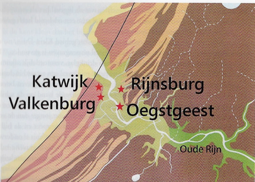
Het gebied van de monding van de Rijn rond 600. De Rijn stroomt uit in de Noordzee; de kustlijn ligt westelijker dan de tegenwoordige, met een zwarte lijn aangegeven, kustlijn (basis kaart: Dijkstra 25).