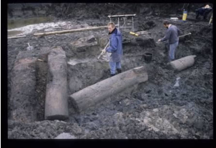
De vondst van vier Romeinse mijlpalen in de Haagse nieuwbouwwijk Wateringseveld was in 1997 een archeologische sensatie. De palen, opgericht tussen 151 en 250, hadden bij elkaar gestaan in de berm van een weg die (Romeins) Voorburg met (Romeins) Naaldwijk verbond. Ze zijn na het vertrek van de Romeinen omgevallen of omvergetrokken en in een berm-sloot beland, en hebben daar de eeuwen overleefd.

Over de leegte, de oorzaken daarvan en de manier waarop zich weer mensen langs de Rijn en langs de kust vestigden en wie dat geweest kunnen zijn, gaan de volgende passages. We besteden daarbij lang aandacht aan het voorspel van de Vroege Middeleeuwen, want alleen in het kader van de gebeurtenissen in de Laat-Romeinse tijd (250-400) kan worden begrepen hoe na 500 de draad van de bewoning weer werd opgepakt.