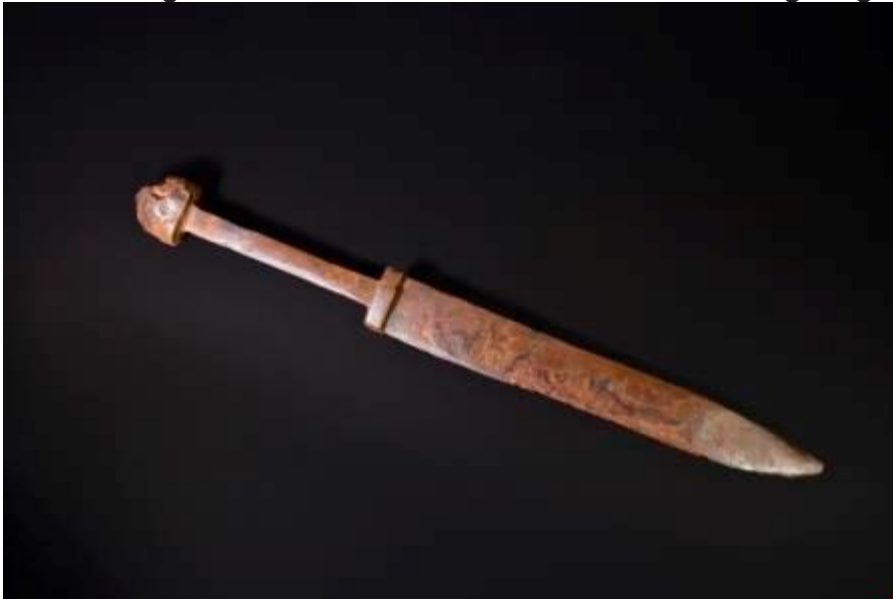
Een kort steek- en hakwapen ('sax'), afkomstig uit een wapengraf dat naast het bijzondere boorgraf van Solleveld lag. Het is aangelegd in de tweede helft van de 6de eeuw.

We menen nu dat we die namen niet kunnen gebruiken als aanduidingen voor destijds bestaande 'volkeren' die er een gedeeld besef van Fries-, Frank- of (Angel)Saks-zijn op nahielden. Waarschijnlijk waren de vroegmiddeleeuwse Friezen niet eens de Friezen uit de Romeinse tijd en hadden ze meer gemeen met de Angelen en Saksen die via Friesland richting Engeland trokken.