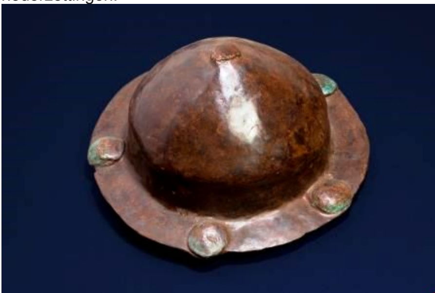
Ook deze schildknop komt uit het wapengraf naast het bijzondere boorgraf van Solleveld.

In ieder geval was er nooit eerder sprake van zoveel variatie in de graven in zo korte tijd binnen een zo beperkt gebied. Pas de afgedwongen invoering van christelijke rituelen in de 8ste eeuw schiep eenheid. Eerst werd het heidense cremen verboden, daarna verdwenen de bijgiften uit de graven, wat later door archeologen zou worden betreurd. Die kregen er echter na 1980 nieuwe gegevens bij, toen de sporen van grafvelden werden aangevuld met die van nederzettingen.