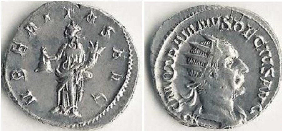
Trajanus Decius, ter ere van wie de laatste Haagse mijlpaal werd opgericht, was een van de vele derde-eeuwse Romeinse keizers die kort regeerde en een gewelddadig aan zijn einde kwam. Niet lang na zijn dood in 251 werd onder een van zijn opvolgers het Zuid-Hollandse deel van de Rijn grens opgegeven.

Rijnkanaal waaraan het stadje lag. Groot was het nooit geweest, en er woonden nog geen duizend mensen, maar dat aantal was sterk teruggelopen.