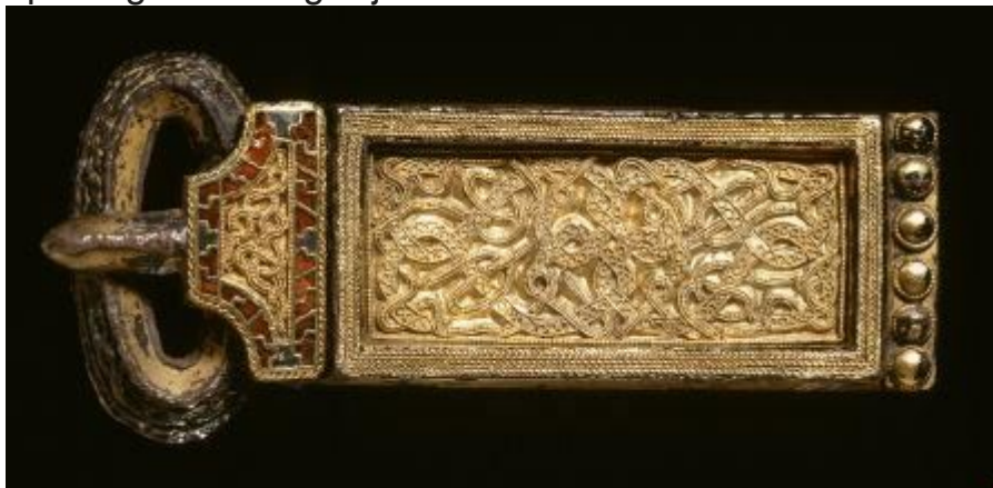
De beroemdste en 'rijkste' vondst van het in 1913 ontdekte grafveld van Rijnsburg-de Horn is deze uitbundig met gouddraad en halfedelstenen versierde gesp van een zwaardgordel. Het is een uniek exemplaar dat Engelse invloeden verraaft en dateert van omstreeks 600. (Collectie Rijksmuseum van Oudheden)

Overeenkomsten in huizenbouw, zelfgemaakt aardewerk, maar ook de aanwezigheid van importstukken van overzee laten zien dat de bewoners van de Zuid-Hollandse kust niet opzagen tegen de oversteek naar Engeland. Ze hadden daar vermoedelijk méér banden mee dan met de christelijke Frankische heersers en hun krijgerbendes, die vanuit het zuiden en oosten opdrongen richting Rijn en kust.