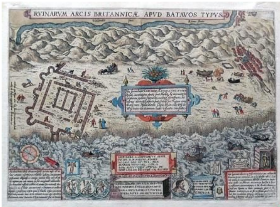
Prent uit 1581 van Ortelius met daarop afgebeeld de raadselachtige Brittenburg. Het fort, waarvan de muurresten in de 16de en 17de eeuw voor de kust van Katwijk te zien waren, heeft nooit al zijn geheimen prijsgegeven. Uit de gegevens die toen zijn verzameld, is echter wel af te leiden dat er binnen die muren een groot graanpakhuis stond. Het wordt in verband gebracht met vierde-eeuwse graantransporten uit Engeland, bestemd voor de door oorlog geteisterde noordelijke provincies van het Romeinse rijk.

Concrete bewijzen voor zulke transporten, voor bedreiging daarvan door piraten en voor de beveiliging daartegen ontbreken overigens. De vermelding van een Romeinse schrijver dat keizer Julianus in 359 langs de Rijn een vloot van zeshonderd schepen liet bouwen en daarmee graan uit Brittannië liet ophalen, lijkt een klassiek voorbeeld van klassiek overdrijven. Nog geen halve eeuw later gaven de Romeinen hun bewind in dit deel van Europa voorgoed op.