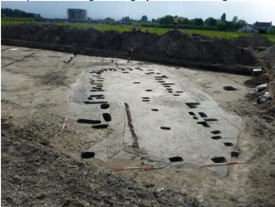
Vanaf de storthopen kijken archeologen naar de uitgegraven paalsporen van een vroegmiddeleeuws huis dat ze bij Oegstgeest hebben opgegraven. Duidelijk zijn de tegenover elkaar liggende ingangspartijen te zien.

van de Leidse Universiteit tussen 2009 en 2014 uitvoerden in Oegstgeest-Nieuw Rhijngest laten een heel ander aspect zien van de kustsamenleving dan het Haagse onderzoek. Hier leefde men langs en met de rivier, met alle voordelen – een snelle verbinding naar zee én naar het achterland – en alle nadelen van dien, zoals voortdurende wateroverlast van de onbedijkte rivier. Net zoals de kustscheepvaart vooruit wees naar de latere middeleeuwse handel vanuit Friesland en Holland, was het aanleggen van beschoeiingen en grote dammen een vroeg voorbeeld van Hollands watermanagement. Het moet veel energie hebben gevegd van de kleine dorpsgemeenschap – meer dan tussen de 50 en 100 mensen zullen er niet hebben gewoond. Maar het was welbestede moeite, want woonplaatsen langs de rivier zoals deze boden veel mogelijkheden. Ze zijn ook aangetroffen en deels onderzocht in Katwijk, Rijnsburg, Valkenburg, Koudekerk en Leiderdorp, en het lijkt erop dat langs beide oevers van de benedenloop van de Oude Rijn een kralensnoer van lintnederzettingen heeft gelegen, allemaal een paar huizen groot zonder veel onderlinge verschillen in grootte en functie, ruim voorzien van schuren en waterputten en zo goed mogelijk beschermd tegen wateroverlast.