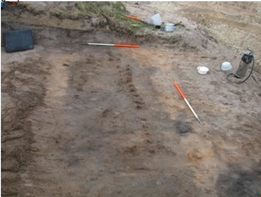
Rijen verroeste klinknagels in het duinzand van Solleveld geven aan waar in de zevende eeuw een bijzonder graf was aangelegd. Van stukken oude scheepswand had men een omgekeerde boot geconstrueerd, waaronder een man begraven lag. 'Bootgraven' zijn wel bekend uit Scandinavië, maar dit is het enige voorbeeld uit Nederland, waarbij bovendien geen echte boot maar een samengestelde is gebruikt.

Bij de opgravingen van het Romeinse fort in Valkenburg zijn onder de sporen van de eerste kerk een paar 8ste- en 9de-eeuwse graven gevonden, waar geen crematiegraf tussen zat. Gezien de aard van deze vindplaats zal de introductie van het christendom, waarin cremeren taboe was, een rol hebben gespeeld.