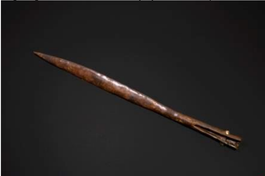
Speerpunt uit het wapengraf dat naast het bijzondere boorgraf van Solleveld lag. Het is aangelegd in de tweede helft van de 6de eeuw.

Vergeleken met voorgaande perioden, de Romeinse tijd en de late prehistorie, deden de duinbewoners veel aan jacht op klein en groot wild. Botten van wilde vogels, hazen en edelherten zijn er de bewijzen van. Ook moeten ze de zee op zijn getrokken om te vissen, getuigde de visbotjes die uit grondmonsters werden gezeefd. Zelfs bruinvissen en walvissen werden gegeten of verwerkt, al zullen die niet op volle zee zijn gevangen maar dood of zieltoegend op het strand zijn gevonden. Varen deden ze wel; op de opgravingen zijn ijzeren nagels gevonden die waarschijnlijk van scheepswanden afkomstig zijn.