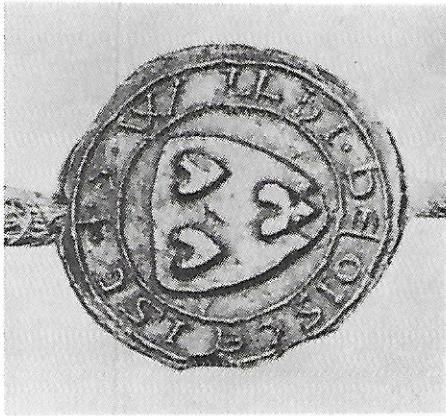
Zegel van Willem van Oestgeest, naar afbeelding in Ned. Leeuw 1922, nr. 4.

Oorkonde betreffende de uitgifte van de heerlijkheid van Oestgeest door Willem van Beyeren, graaf van Oostervant, ten behoeve van Philips van Wassenaer, burggraaf van Leiden.