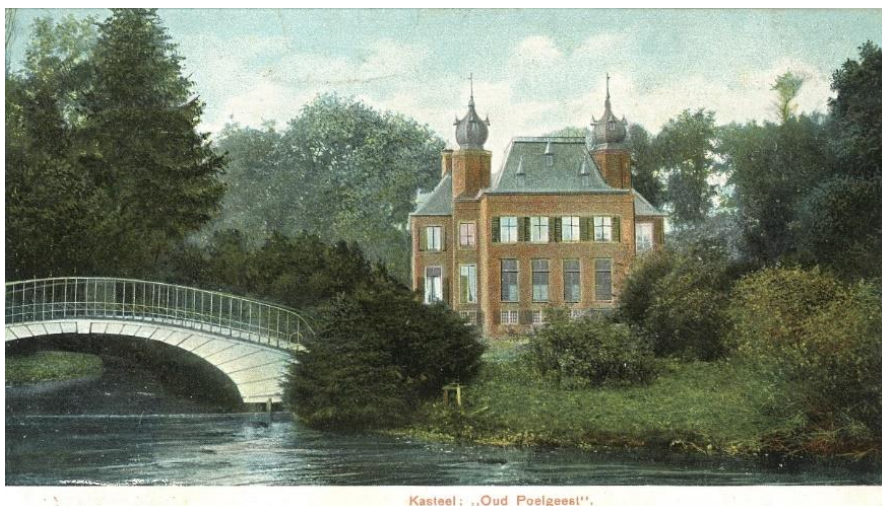
Kasteel: „Oud Poelgeest“.

De combinatie van de verschillende gebouwen, groene structuren en de ligging aan, en zicht op, de Haarlemmertrekvaart is van zodanige waarde dat deze behouden dient te blijven en versterkt dient te worden, zoals bijvoorbeeld door de aanlegsteiger welke is teruggebracht.