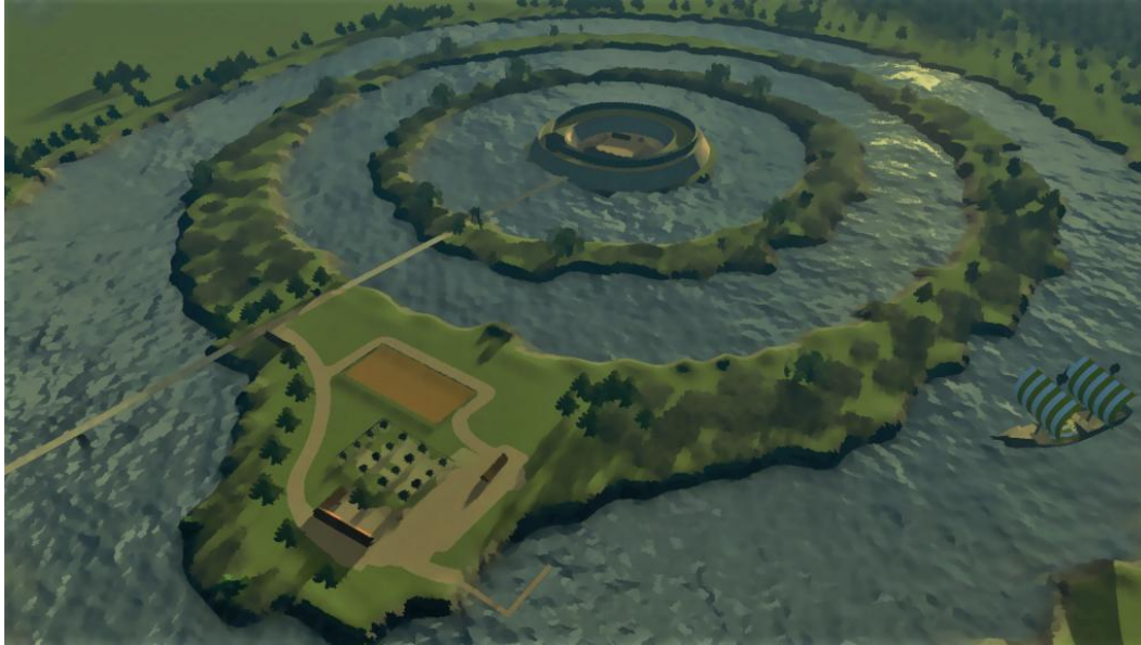
'artist impression' van hoe de Oudenhof er mogelijk uitzag

In de 9 e eeuw werd Europa geteisterd door invallen van de Vikingen. In 856 was het de beurt aan Noordwijk en werd priester Jeroen vermoord. In Oegstgeest ging het Groene Kerkje in vlammen op.